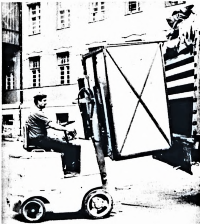
Konténerben érkezik Pécsre a vágott kocsonya