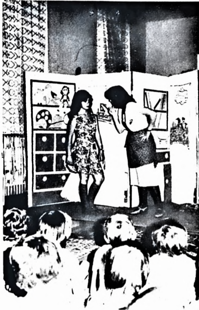
A KISZ-szervezet által rendezett gyermeknap az óvodában

A termelési osztály irányítási rendszere elavult. Az osztály négy merev csoportra való tagozódása abban az időben alakult ki, amikor az egyes tagozódások között többműszakos készletek álltak rendelkezésre, tehát az egyes tagozódások, üzemrészek közötti termelési ütem eltérését a készletek kiegyensúlyozták. Ez a jelenség bizonyos mértékig ma is megfigyelhető az előkészítési és gyártási üzemrészek között. Hiszen a meglehetősen magas félgátrmány-készlet mennyiségi oldalról lényegében nem okoz problémát a gyártási üzemrész anyagellátásának (Folytatás a 2. oldalon)