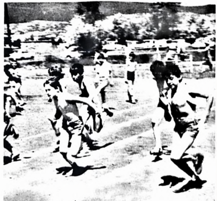
A 10 év felettiek a 80 méteres futóverseny célja előtt