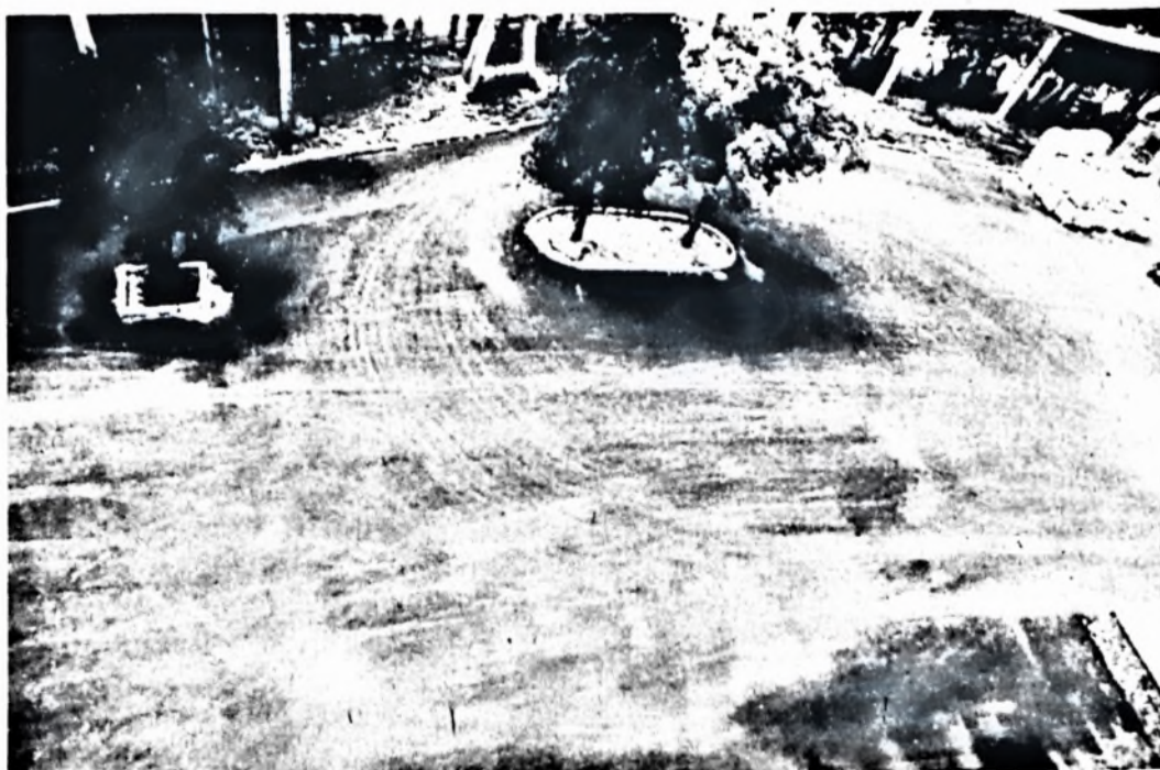
Új aszfaltozás a 2-es raktár körül. Elkészült a 2-es raktár déli és keleti oldalánál az új aszfaltburkolat. Ezáltal a gépkocsik esős időben is kényelmesen tudnak mozogni a rámpák körül. Mindezt 800 ezer forintért végezte a Pécsi Köztisztasági és Útkarbantartó Vállalat