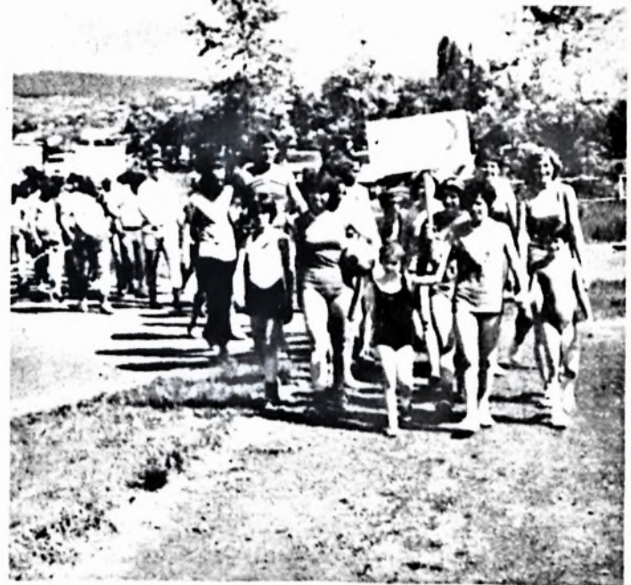
A sportolók bevonulása