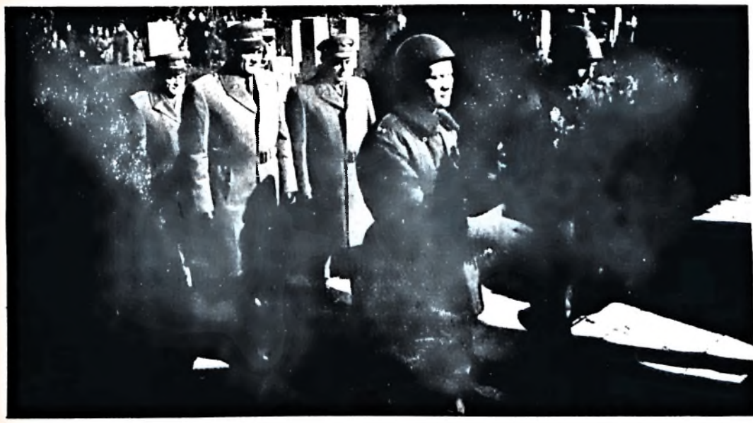
A Szovjet Hadsereg megalakulásának 61. évfordulója alkalmából, a fegyveres testületek pécsi alakulatainak képviselői február 23-án megkoszorúzták a pécsi központi temetőben lévő szoviet hősi emlékművet. Ugyancsak elhelyezték a megemlékezés és a hálá virágait az MSZMP Pécs városi Bizottsága, az MHSZ, a KISZ, valamint a Hazafias Népront képviselői is.