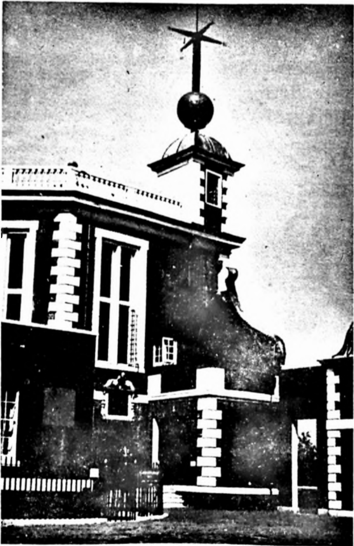
A greenwich-i csillagvizsgáló