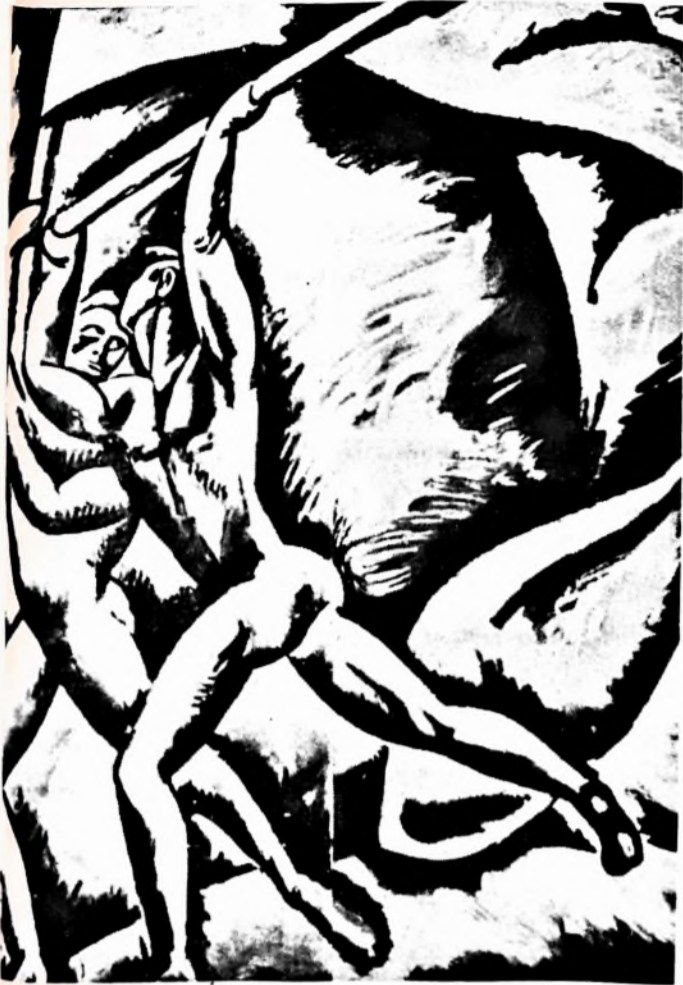
Világ proletárjai, egyesüljétek! Pór Bertalan plakátja