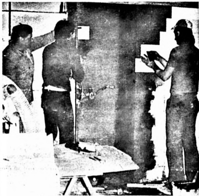
Karbantartóink már a Hauni-féle berendezés helyét készítik elő

A kombináltfilter-gyártó berendezés teljesítménye a szerződés szerint 1700 db percenként. A teljesítményt a szenesfilter minősége szabja meg.