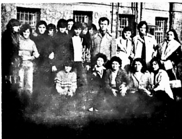
Az egri szakmunkásjelöltek gyárunk udvarán

Evek óta járnak szakközépiskolások vállalatunkhoz, szakmai gyakorlatra. Hol jobban,