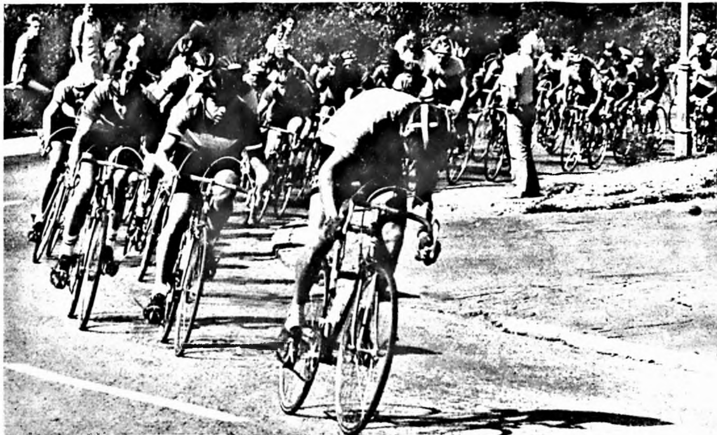
XIX. Mecsek Kupa nemzetközi kerékpáros verseny Pécs, Mecsek 1978. augusztus

Áldozatvállalásukat a vállalat nemcsak erkölcsileg, hanem anyagilag is, célprémium formájában fogja elismerni. A folyamatos munkarend lehetővé teszi, hogy kb. 20 millió darab kettős filterrudat többletként állítsunk elő. Ezzel a mennyiséggel csökken az import kombinált filterrúd behozatala, ami 94 600 dollár megtakarítást jelent. A folyamatos munkarendet november 30-ig terveztük. A MULFI + KDF 2 + CASCAD M nagyteljesítményű kombinált filterrúdgyártó gép üzembeállítása december 15-re várható, amely megoldja a vállalat kettős filterrúd előállítási problémáit.