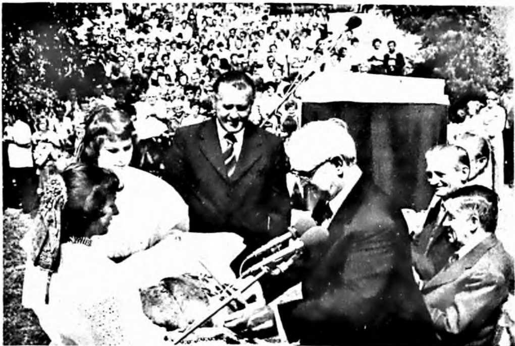
Szerte az országban ünnepekkel, rendezvényekkel köszöntötték szocialista alkotmányunkat. A Baranya megyei augusztus 20-i központi ünnepséget Sellyén Antal, az MSZMP Politikai Bizottságának tagja, az országgyűlés képviselője az Ormánság földjén teremtett idej búzából sülttől elsőrendűként ünnepelték meg, amelyen Apró Antal elnöke mondott beszédet. Képenyert átnyújtják Apró Antalnak.