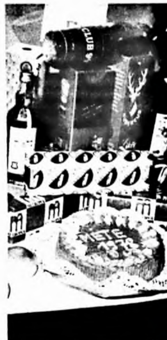
A MÉTE találkozóon bemutatott a megye élelmiszeripari üzeminek termékeit.