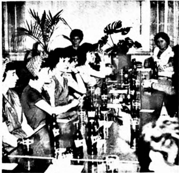
Felvételünk a szakszervezeti oktatás zárófoglalkozásán készült

Befejeződött a „Munkahelyi élet időszerű kérdései” szakszervezeti politikai oktatás. A szakszervezeti oktatás célja, hogy tagjait a művelődés magasabb fokára segítse.