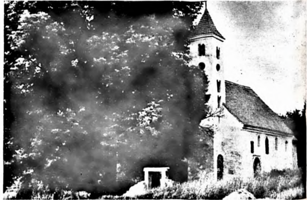
A mánfai műemléktemplom.