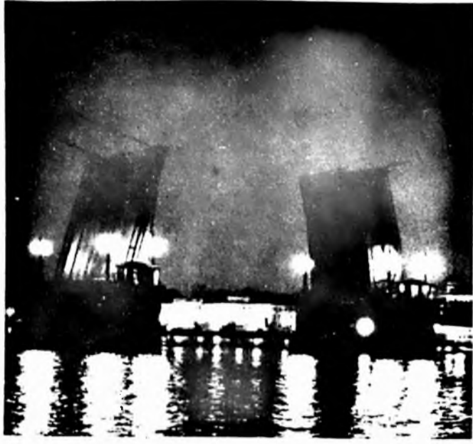
Fényárban úszó felvonóhíd a Néván