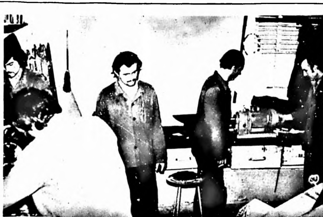
Munkában a karbantartók. A Szedell-brigádról szóló riport a harmadik oldalon olvasható