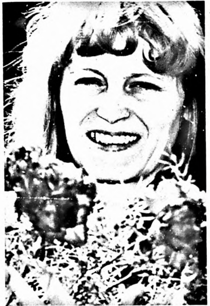
A nemzetközi nőnap alkalmából köszöntjük lányainkat, asszonyainkat