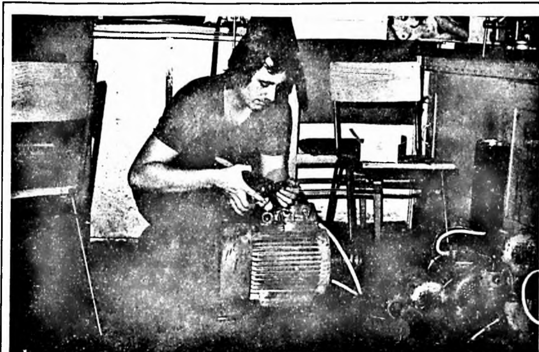
Amerikai gyártmányú kábelsarufogókat kaptak villanszerelőink. A kábelsatlakozásoknál és a villanymotoroknál megszüntethető az ilyen helyeken keletkező üzemzavarok.