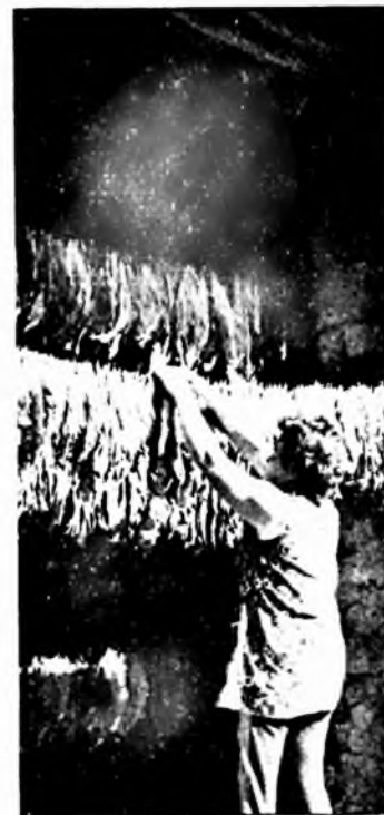
Felfűzött dohánylevelek szárítása

denciára jellemző a füstszűrős cigarettafogyasztásának rohamos növekedése. Jelenleg a termékeknek 72%-a füstszűrős, ez majdnem 5%-kal nagyobb mint az előző évben. Itt érdekes összehasonlítást tehetünk. Világszerte nő - nyilván az egészségügyi propaganda hatására - a füstszűrős cigarettafogyasztás aránya. 90%-felett van az európai országokban: Ausztria, Jugoszlávia, Svájc, Finnország. Az amerikai kontinensen: Egyesült Államok, Kanada és több kis államban. Ezen kívül Japánban közel 100%, 80%-felett: Csehszlovákia, Görögország, Nagy-Britannia, NDK, NSZK, Olaszország stb. Tekintettel arra, hogy nálunk a filteres cigarettatermelése elég későn kezdődött - 1961-ben -, ehhez képest igen hamar felzárkóztunk a nagy filteres cigarettafogyasztókhoz. Világszerte, - nálunk is - gyorsan növekszik a nagyhatású, jobb szűrőképességű filterrel ellátott termékek fogyasztása. Nálunk forgalmazott ilyen termékek a Sopianae, Tabán és a Metropol. Legnagyobb sikere a Sopianae-nak van, fogyasztása igen rövid idő alatt meghaladta az 1 milliárdot. A múlt évben voltak is termelési gondjaink, sajnos az