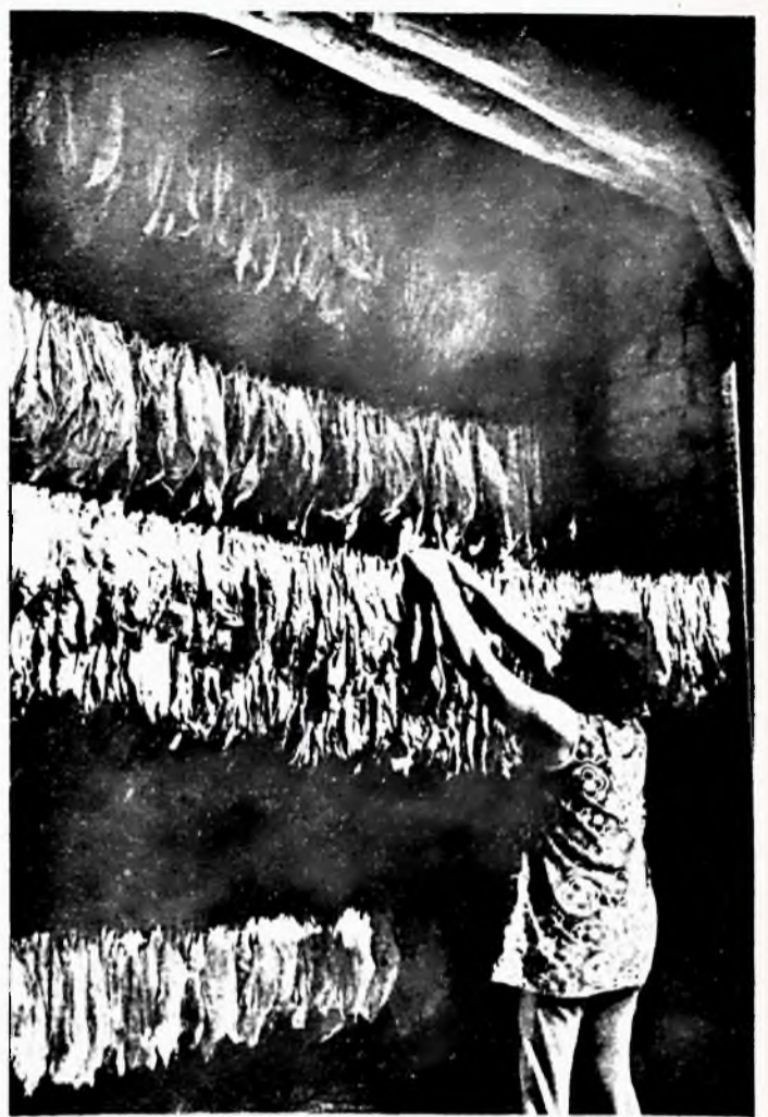
Dobos Gyuláné pajtájában már felfűzve barnulnak a dohánylevelek. (Riport a 3. oldalon.)

Vállalatunk dolgozóinak tíz százaléka bejáró