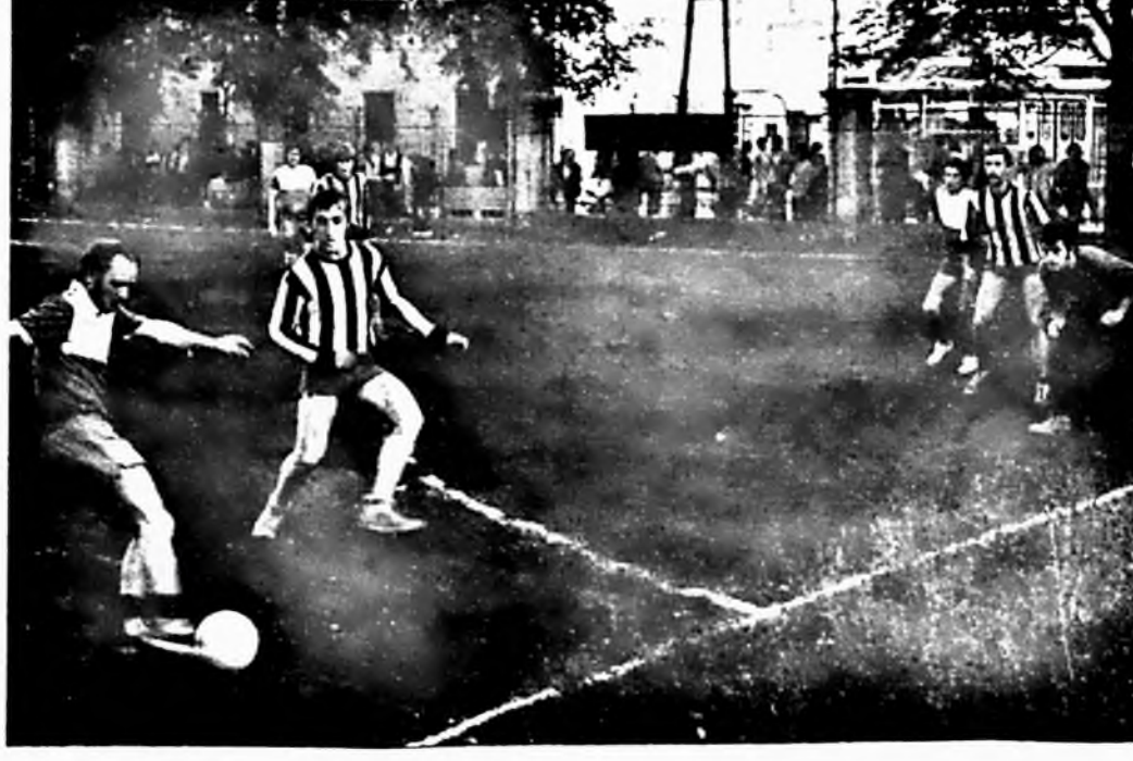
Ebből az Albrecht beadásból gól született. Dohánygyár I.—Húsipari 1:0.