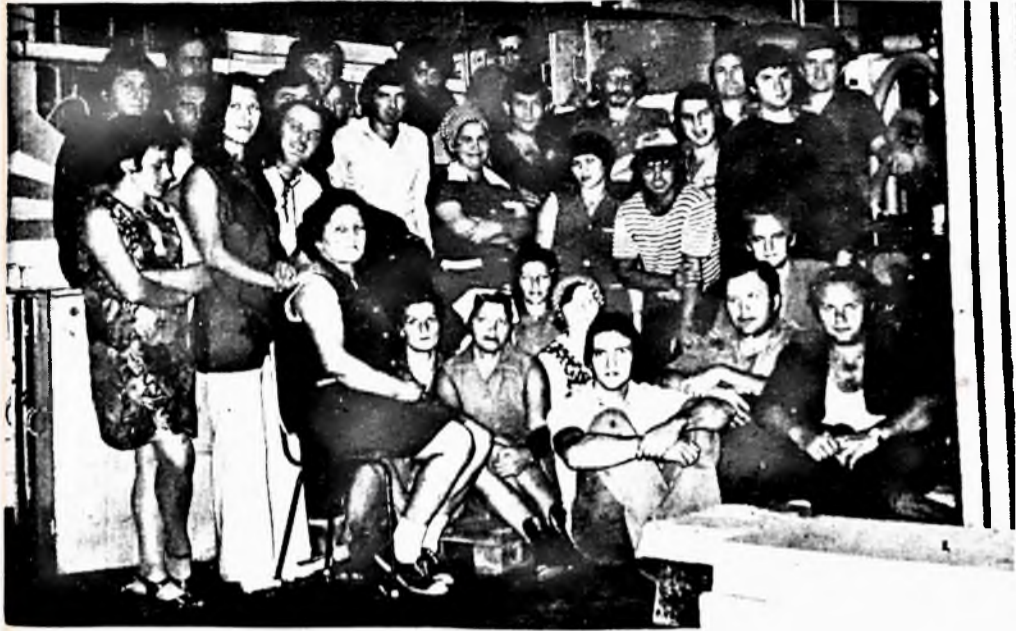
A szervizműszak dolgozói.