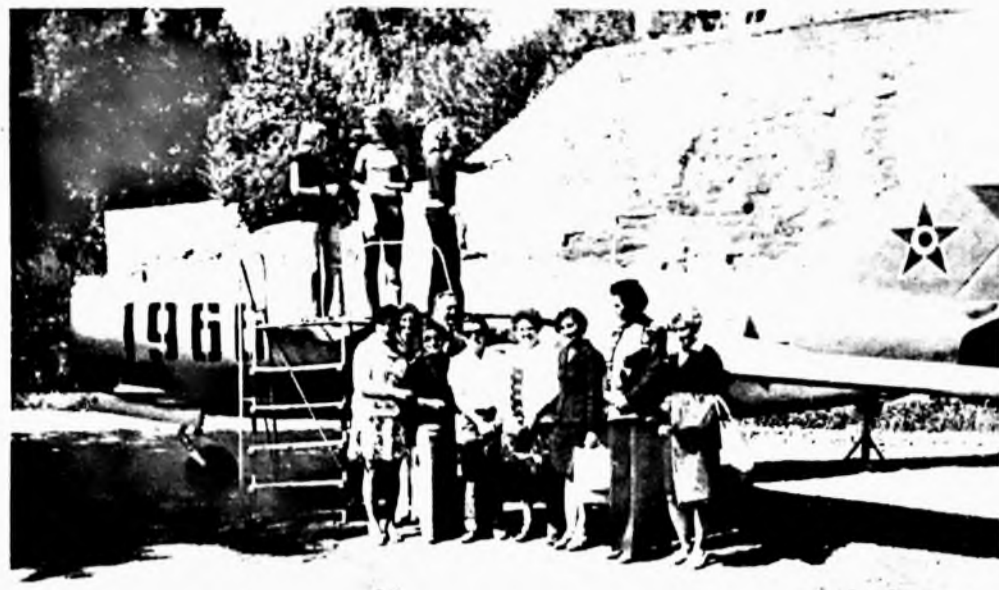
A két brigád néhány tagja, a szigetvári várban.