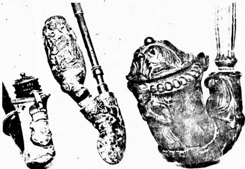
Az ibafai gyűjtemény három értékes darabja. Jobbról a nevezetes ibafai papi pipa másolata.