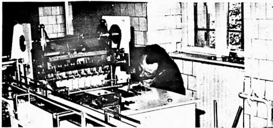
Az új gyűjtőcsomagoló gép beállítását végzi a csehszlovákiai SKODA gépgyár szerelője. A hónap végén már ezzel a géppel csomagoljuk a Metrop ol cigarettát.

Mit jelent vállalati szinten beruházni, fejleszteni, mit értünk hatékonyságon? Ohatatlanul felvetődik mindannyiunkban a kérdés, számtalan értekezleten, termelési tanácskozáson elhangzik egy-egy jól megalapozott igényre a válasz: „ez sajnos beruházás, nincs rá pénzünk!” Kevesen tudják, hol van a választóvonal, mikor különül el a fejlesztési alapot igénylő tevékenység az egyszerű költségjellegűtől, hol találkozik a kettő, mi a forrása a vállalat fejlesztési alapjának, hogyan kerül felhasználásra, milyen és mekkora fejlesztést képes rehaajtani a vállalat adott időszakon belül, s ez a fejlesztési tevékenység mennyire hatékony, mennyire hatékony a meglévő állóeszköz-állomány kihasználása? Számtalan, egymástól el nem választható, csak együttesen, kölcsönhatásaiban vizsgálható probléma. Az általános tájékoztatáson túlmenően a vállalati beruházási tevékenység elsődlegességét szem előtt tartva megpróbálunk a fenti kérdésre kielégítő választ adni.