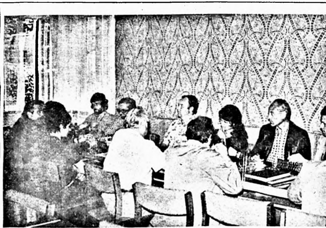
A Pécsi Sütőipari Vállalat szocialista brigádvége től május közepén tapasztalatcsere látogatást tettek gyárunkban. Az üzemlátogatást követően a tanácsteremben találkoztak szocialista brigádvezetőkkel és megvitatták a két vállalat brigádmozgalmának helyzetét és továbbfejlesztésének lehetőségeit.