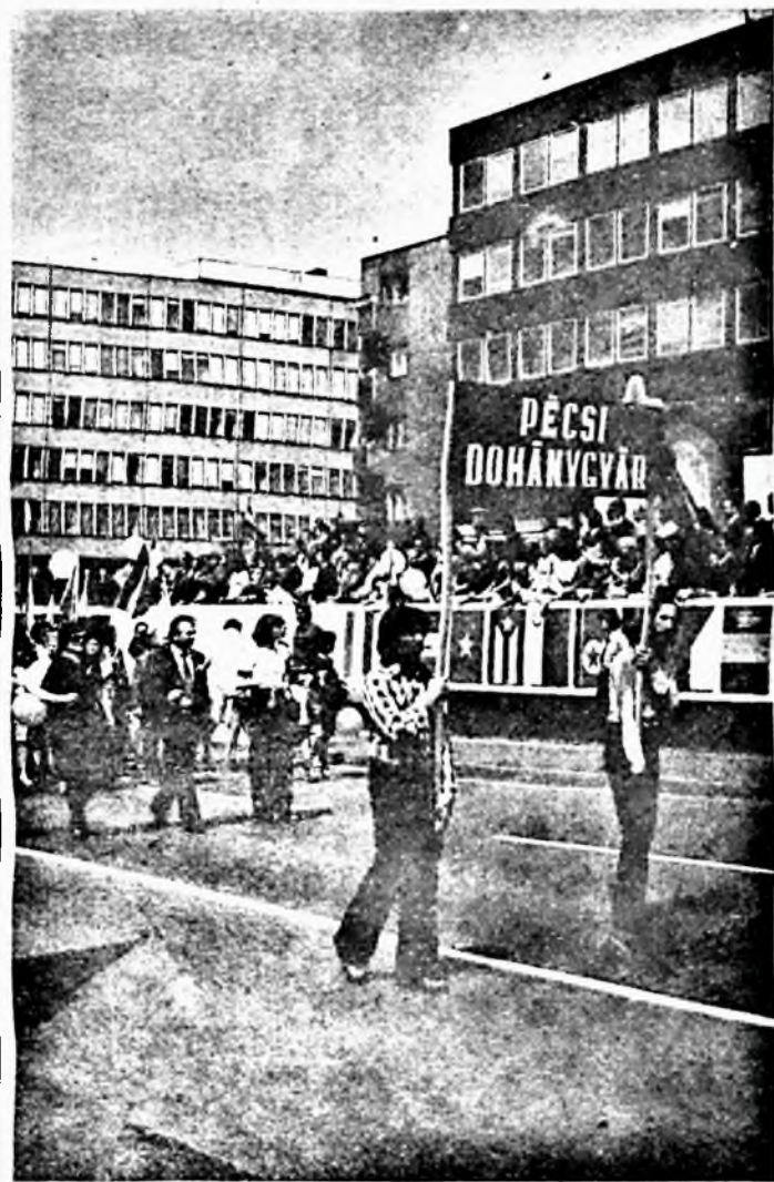
Dolgozóink, a disztribúción előtt, a május elsejei felvonuláson