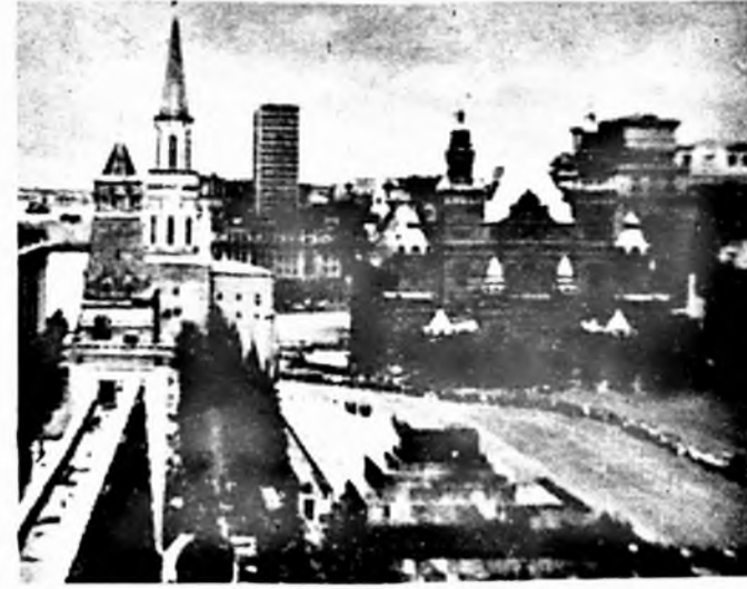
A Megyei Pártbizottság a nemzetközi nőnap alkalmából 280 fős Baranya megyei nőkül-

döttséget szervezett Moszkvába. A csoportunk március 5-én reggel indult, öt napra. In-