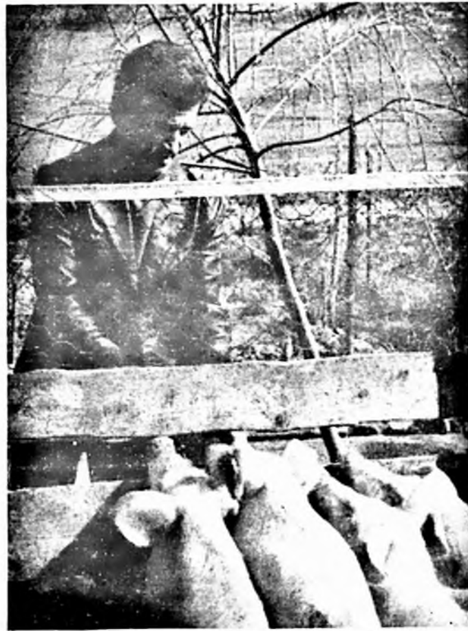
Florián Lajos: építke egy új ólót, ahol önitató-önetető rendszert alakított ki...