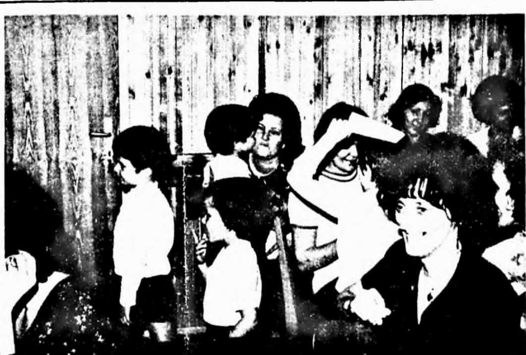
A „Tobak” brigád nőnapj ünnepségén a gyári óvodások is köszöntötték a szocialista kollektíva tagjait.

A hozzászólásokat követően, a szocialista brigádmozgalmában legkiemelkedőbb kollektívák vezetőinek jutalmakat nyújtottak át. Vállalatunktól, a gyártásból a Lendület, a karbantartóktól pedig a Déri Miksa brigádot jutalmazták.