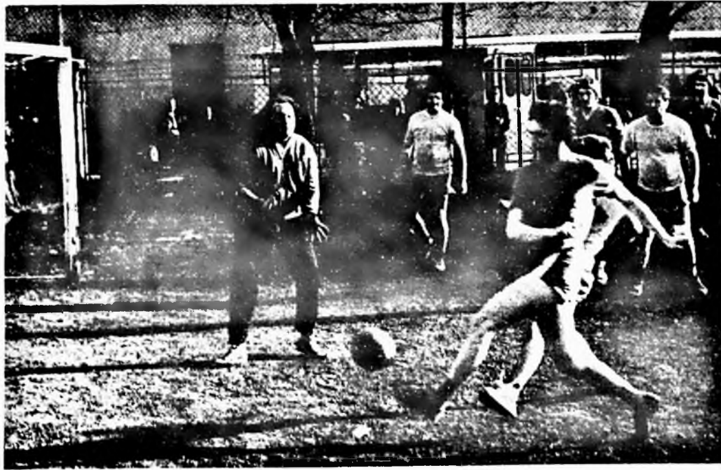
Edzőmérkőzés hazai pályán. Játékosaink ezúttal nem tudták ki használni az otthon adta előnyöket. EIVRT Sopiana—Dohánygyár 4:0.