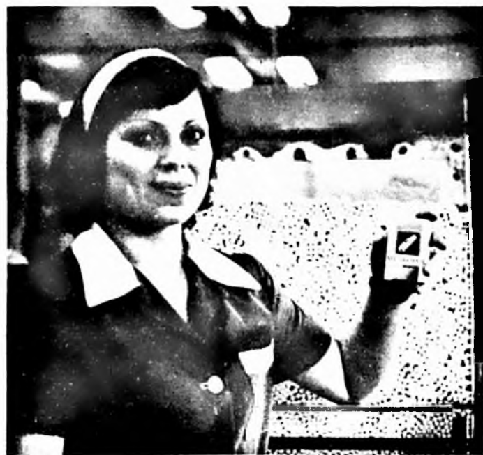
Az év végi ünnepekre az üzletbe került vállalatunk új multifilteres cigarettája, a Metropol. Dolgozóink összefogásának köszönhető, hogy a vállalat húszmillió cigarettát dobozokba került.