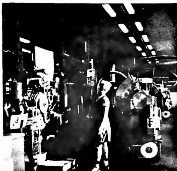
Nagy teljesítményű Dekajet—MAFI cigarettagyártó és filter-felrakó gépsor.