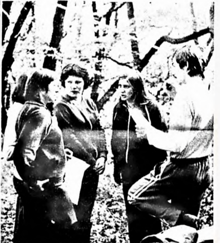
— Ezt a kérdést, hogy oldjuk meg? Csapatunk a „November 7.” emléktúra egyik állomásán.

Szép, verőfényes őszi napon került megrendezésre a Városi KISZ-Bizottság által szervezett „November 7.” túra. Bár sütött a nap, de a kora reggeli őszi levegő kissé hideg volt és vacogva vártuk, hogy indulhassunk. A meredek úton felfelé menet azonban hamar kimelegedtünk. Az akadályokat jókedvűen, egymásnak segítségét nyújtva küzdöttük le.