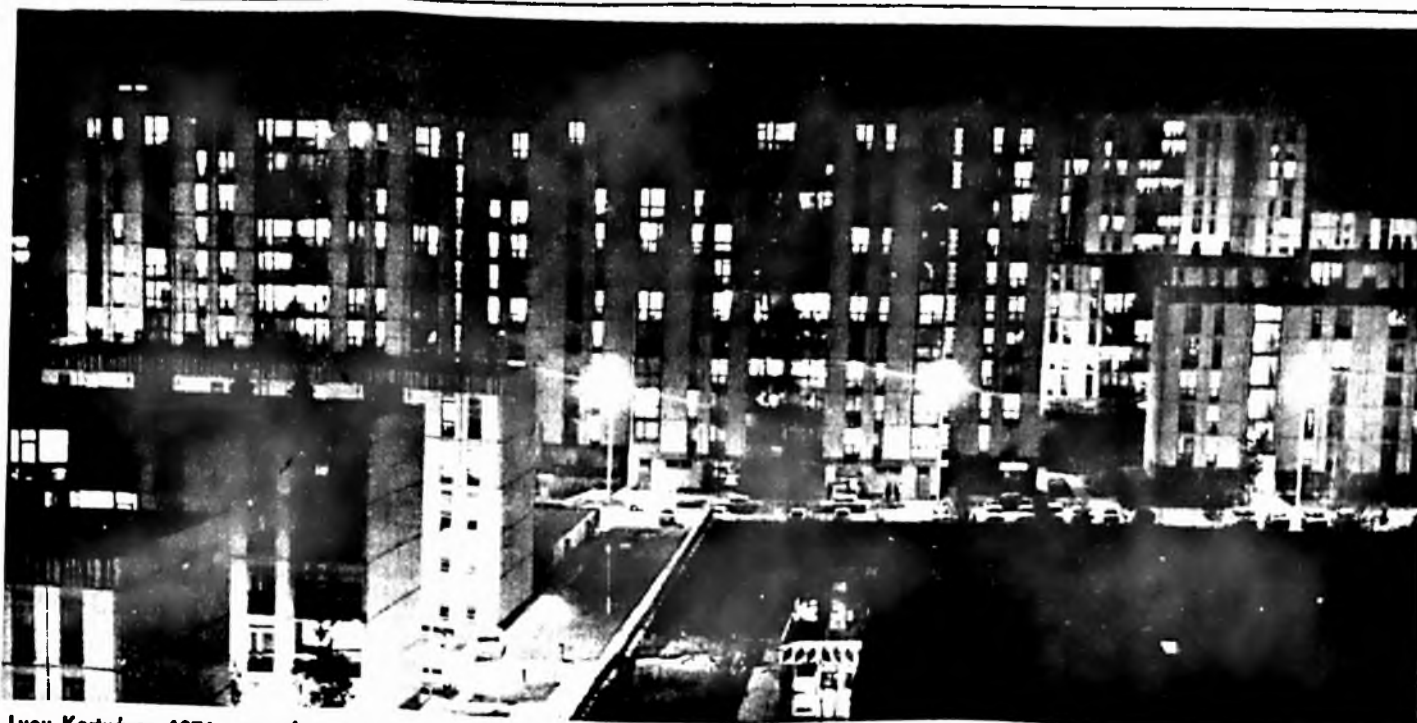
Lvov-Kertváros 1976 november

A munkaversenyben a kitűzött és vállalt 3,50-es minőségmutató I.—III. negyedéves szinten teljesült.