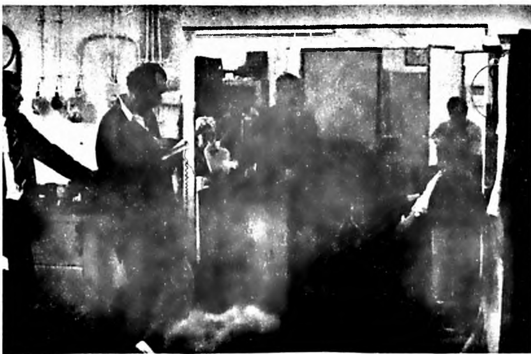
A műszaki konferenciát követően termelési tanácskozásokon vitatták meg dolgozóink a IV. negyedévi célkitűzéseket. Képünk, a karbantartó üzemszermelési tanácskozásán készült.

nyű” cigaretták közé tartozik. A Milde Sorte füstszűrője is eltér a hagyományostól, a filter előtti papíron apró lyukak vannak, amelyeken a szíváskor friss levegő áramlik be, s ezáltal növekszik a filter szűrőképessége. Az Austria Tabakwerke nemcsak a gyártási leírást, hanem pác- és aroma anyagokat is szállít a magyar partnernek.