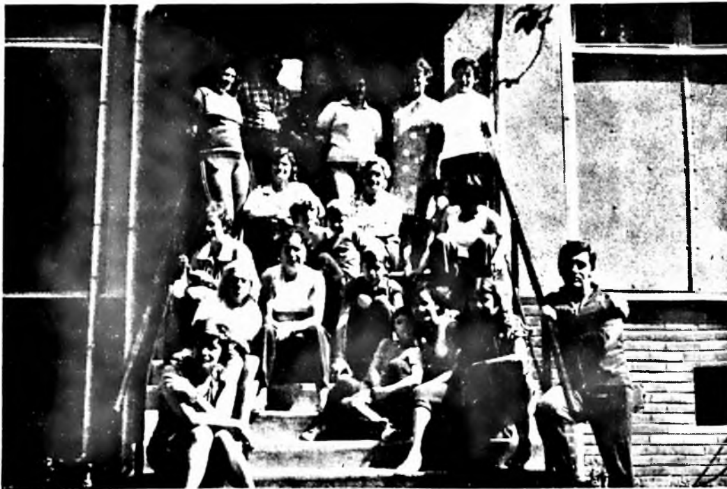
Dolgozóink egy csoportja, a pocsuvadlói üdülő bejáratánál.