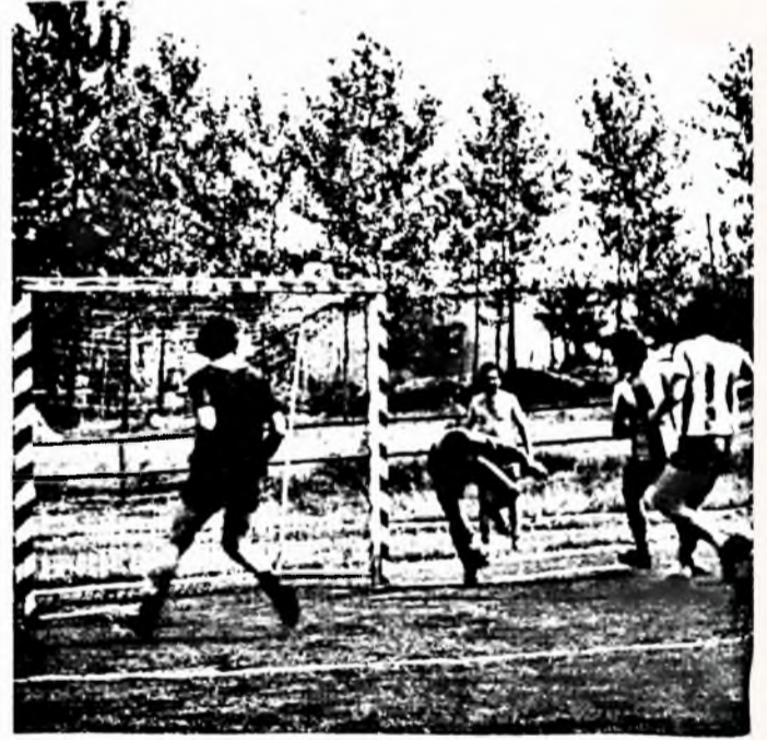
Dohánygyár — Tejipar