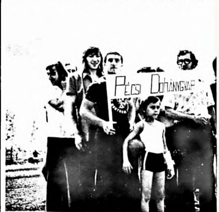
Gyárunk csapata, a június utolsó vasárnapján rendezett ÉDOSZ sportnap megnyitóján, a Kínizsi pályán.