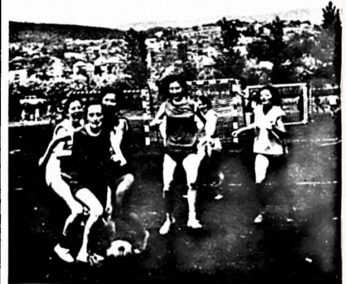
A dohánygyári és sütőiparos lányok vegyescsapata.