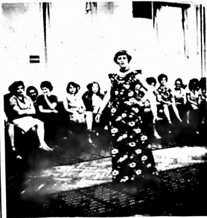
Május utolsó szerdáján divatbemutatót rendeztünk vállalatunknál. A pécsi Centrum Aruház manekenjei, a legújabb divat szerinti készült ruhákat mutatták be dolgozóinknak a gyár éttermében.

Lakószobájuk, ahol a nap majd minden óráját eltöltik, különösebb értékek, díszek nélkül.