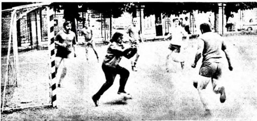
EDOSZ-kupa: Dohánygyár I.—Dohánygyár II. 0:0.