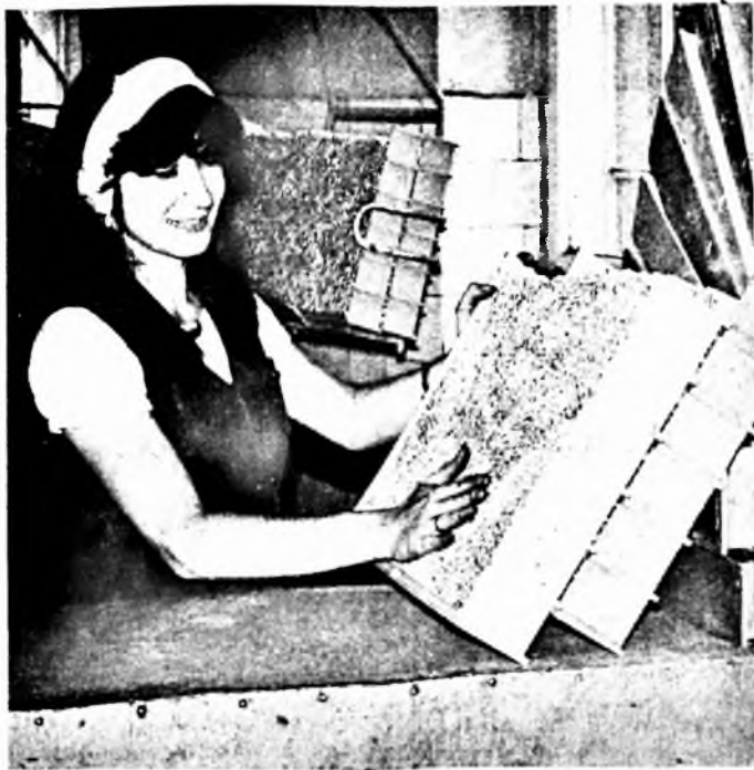
Pécs város párt. és állami vezetőinek felhívására május huszonekedikén, szombaton kommunista műszakot tartot-

és óvodaépítési akcióból kommunista műszak teljesítésével és az így keresett munkabér teljesebb megvalósításával segíti elő Pécs bölcsődei és óvodái gondjainak csökkentését.