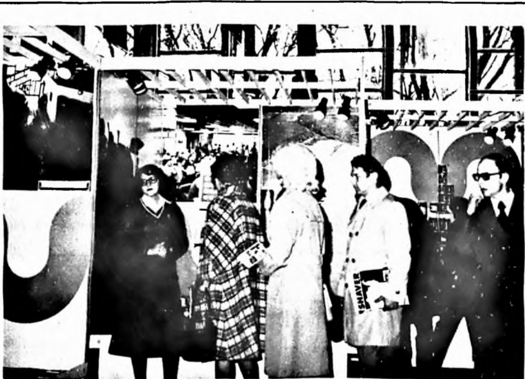
Százezen tekintették meg Pécs testvérvárosában, a szovjetunióbeli Lvovban azt a kiállítást, amelyen megynék mutatkozott be. A kiállításon részt vett vállalatunk is, az általunk gyártott termékekkel. Képünkön a bemutató egy részlete.