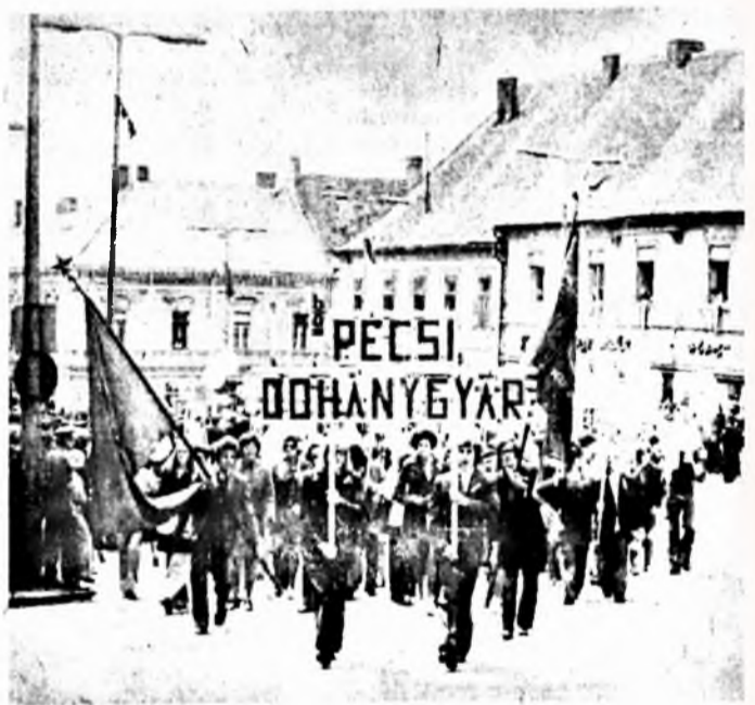
Vállalatunk dolgozóinak menete a Széchenyi téri díszmegalvány előtt.