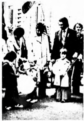
— De szép lufid van! Nagy László felv.

— A KISZ IX. kongresszusa tiszteletére vállaltunk KISZ-szervezete május 8-án politikai vetélkedőt szervezett. A versenyző gyári fiatalok közül az első helyet az előkészítés csapata szerezte meg.