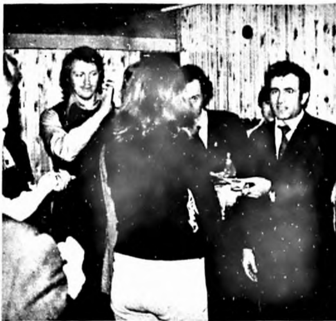
Városunkba látogatott Lvov testvérmegye negyven fős turista csoportja. A szovjet fiatalok megtekintették a Pécsi Dohánygyárat is, majd az ifjúsági klubban találkoztak a munkásfiatalokkal, ahol köztelen és közvetlen beszélgetés alakult ki a vendégek és a házigazda kisaszerek között. A képen ajándékokat cserélnék a fiatalok.