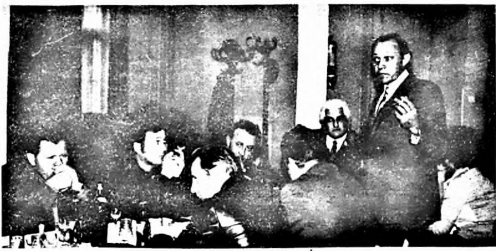
Február 19-én dohánytermesztési tanácskozást tartottunk vállalatunknál

A jelenlegi, mintegy 10 mázsa hektáronkénti átlagtermés öröbvétele a jelenlegi árakon nem biztosítja a termeléshez szükséges gépi berendezések gyors megtérülését, tehát olyan