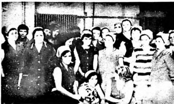
Az előkészítő üzem rész Vörösmarty szocialista brigádja