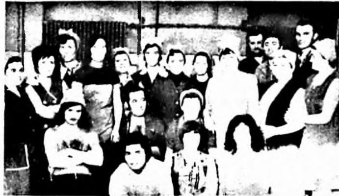
Az Ady Endre szocialista brigád

— Jól megvagyunk, megértjük egymást. Igyekszünk a fiatalokat betanítani. Aránylag szigorú elvek szerint döntjük el, ki lehet brigádtag, ki nem. Nem engedhetjük meg magunknak, hogy hibázzunk. A dolgozók húsz százaléka nem tagja az Adyknak és a Vörösmartyknak. Közöttük vannak azok, akik képtelenek a beilleszkedésre, vagy rossz munkájuk, magatartásuk miatt nem pályázhatnak közénk. Legfontosabb feltételünk, hogy aki év közben jön — akár január—