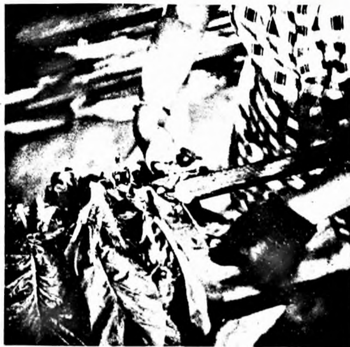
Hol van már a tavalyi virszinia?