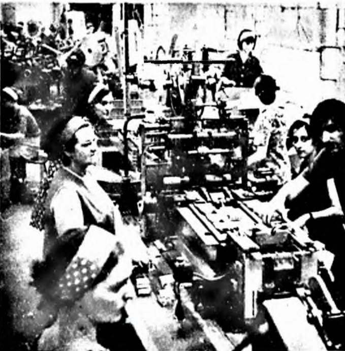
Korszerű DEKAJET típusú cigarettagyártó gép

1973. augusztus 21-én a vállalat körültekintő és alapos felmérést követően, szervező tevékenység után átállt egy magasabb színvonalú, korszerűbb munkaszervezetre, amely lényegében abból áll, hogy a termelés különböző alapvető funkcióinak célirányos csoportosításával a tevékenységi funkciókat napi két termelő műszakba és egy szervizműszakba csoportosítottuk. Az új munkarendre való átállást megelőzően dolgozóink jelentős része szakmai továbbképzésben részesült. Közülük több szakmunkás az NDK-ban szerzett továbbképzést vállalatunk szervezésében. Rendkívül hatékony szerepet tölthettek be vállalatnál szervezett továbbképzések. Ezek a továbbképzési tanfolyamokon ismerték meg dolgozóink az új berendezések működési rendszerét, a hibaelhárítások formáit, a korszerű technikát és ehhez kapcsolódó műveleti utasításokat. Az új munkarendre való