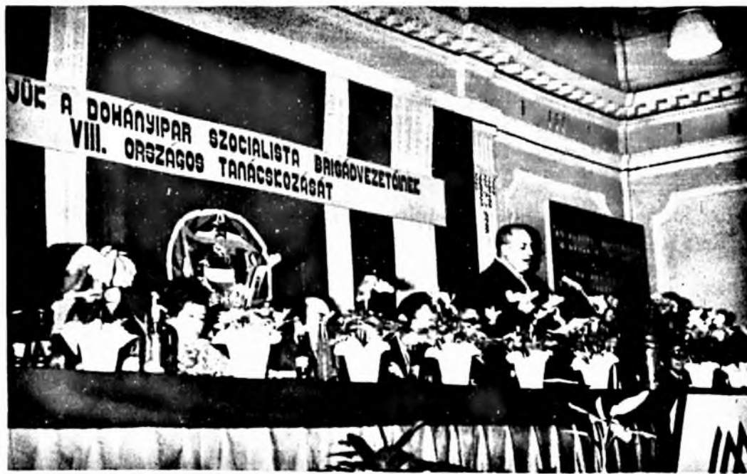
Nyiregyháza tartották az iparág szocialista brigádvezetőinek tanácskozását.