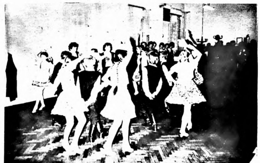
A pécsi Mátyás király utcai iskolások ünnepi műsora