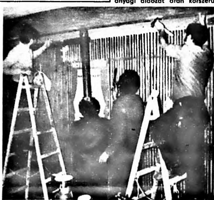
Gyári szakiparosok a klubban