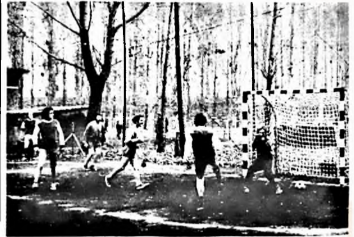
Dohánygyár—VOLAN II. 4:3

Végetérték mind a városi bajnokság, mind az ÉDOSZ kupa mérkőzései. A játékosoknak több lett a szabad idejük a hétfő és csütörtök délutánnal. Ezt az időt akár elmélkedésre is fel lehetne használni. Lehetett volna jobban, eredményesebben? A második helyezettől lefelé bármely csapat válasza lehetne: Biztosan!