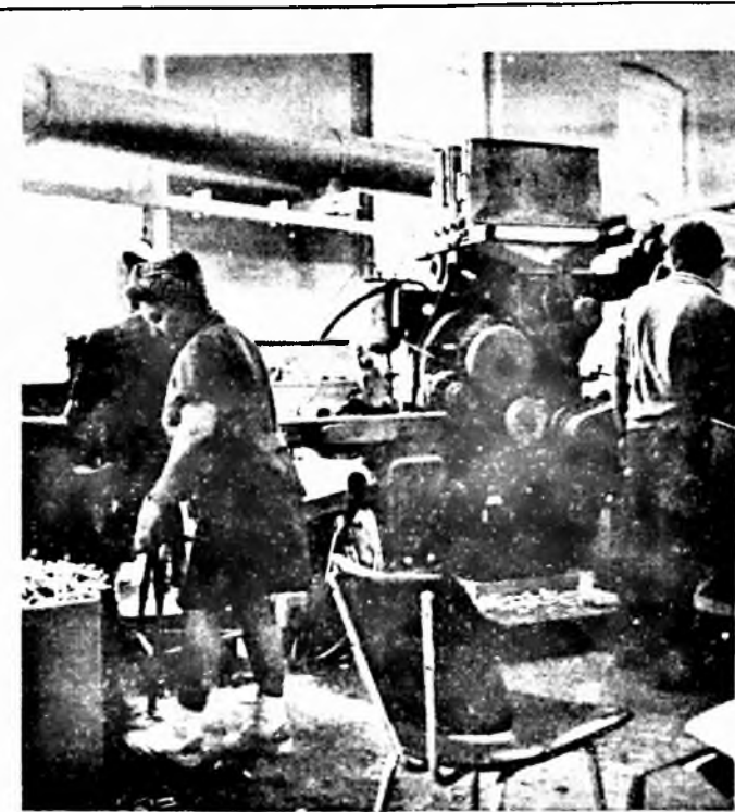
A nyári nagyjavítást követő első műszak a gyártásban

FIATAL MŰSZAKIAK ÉS KÖZGAZDÁSZOK TANÁCSA