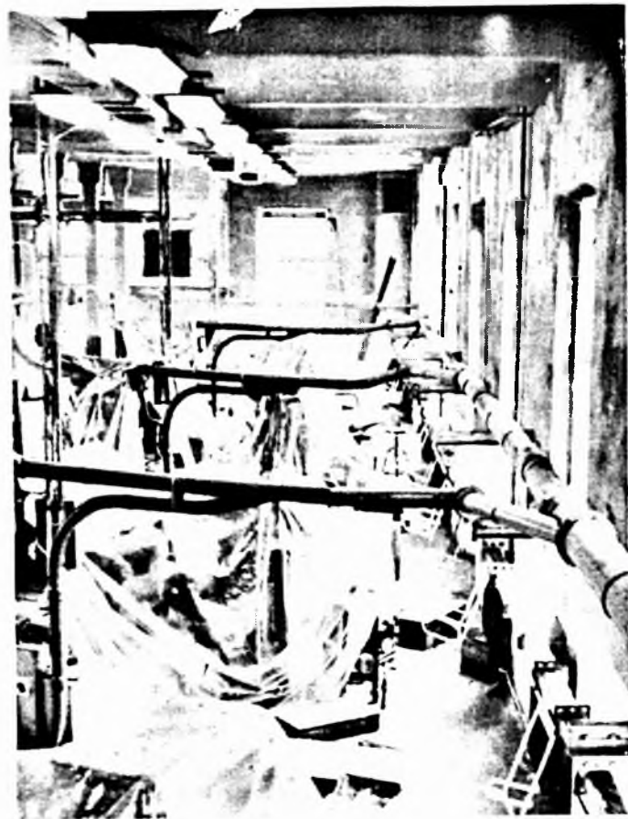
Ures a konveor pályá, a cigarettagyártó gépeket fólia takarja. Riportunk a harmadik oldalon