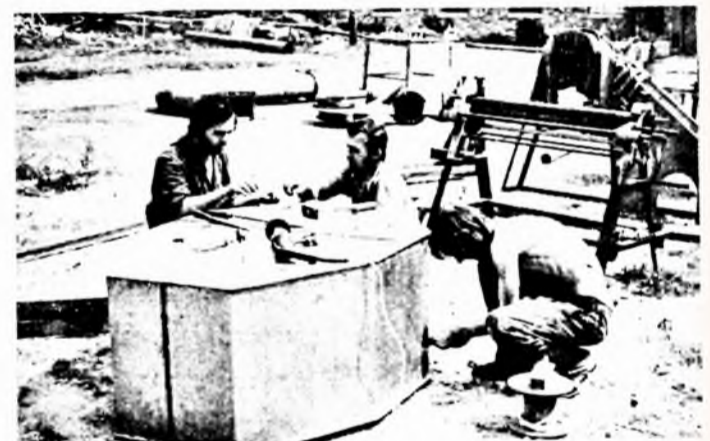
A pácolóberendezés garatjának szerelése közben