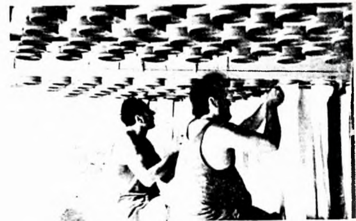
Szerelik a zsákos szűrőket