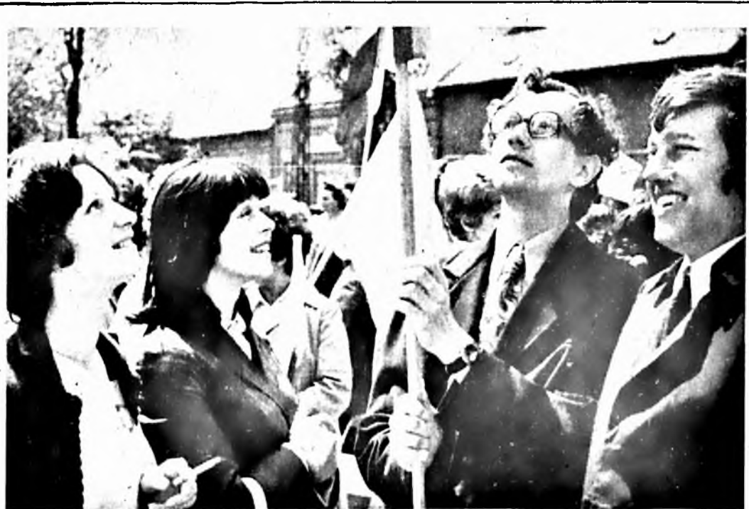
Gyári fiatalok a május 1-i felvonuláson.

A tájékoztatás után a vitában 12-en szavaltak fel. A konferencia igazgató elvtárs összefoglalójával ért véget.