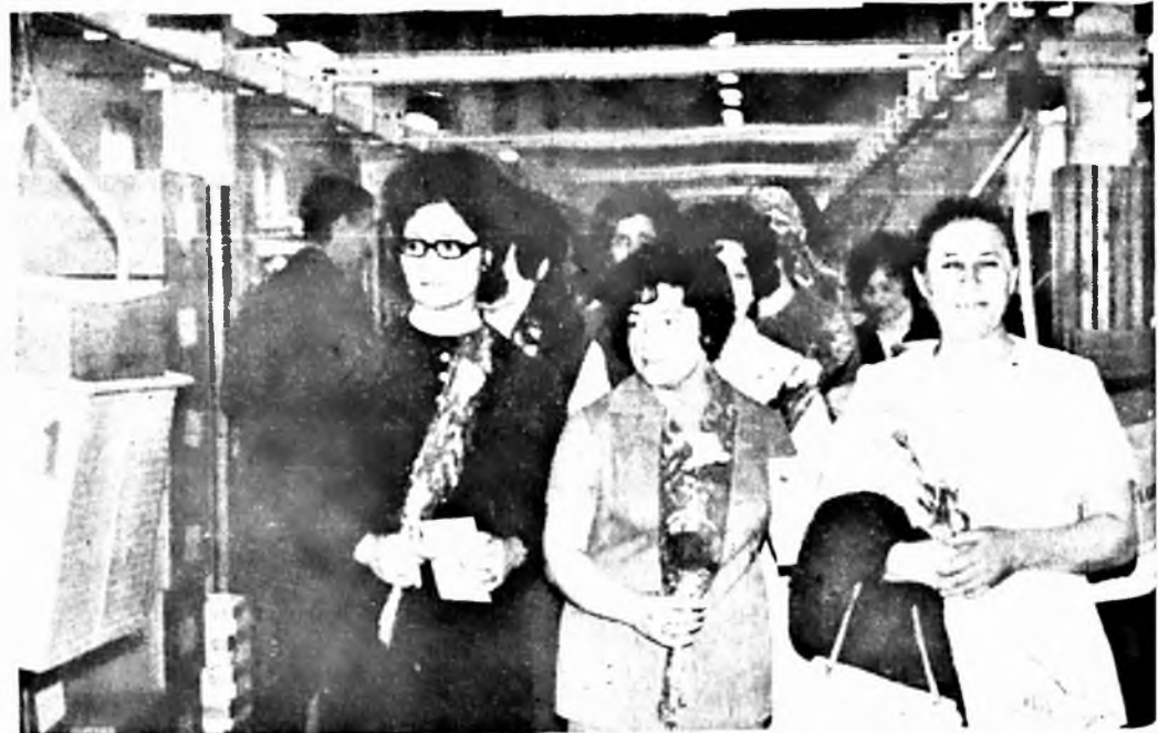
A Győzelem Napja előtt néhány nappal az MSZMP Baranya megyei, valamint Pécs városi Bizottsága szervezésében a Szovjet Déli Hadserlegcsoport katonatisztjeinek feleségei meglátogatták gyárunkat. A huszonöt katonafeleség kellemes órákat töltött nálunk. Képünkön: vendégeink gyámézőben.

A dolgozókat az üdülésre, üdülési bizottság javasolja. A kedvezményes üdülésre első sorban azokat a dolgozókat javasoljuk, akik egész évi munkájukkal erre rászolgáltak, valamint figyelembe kell venni a beutalást szociális és egészségi körülményeit is.