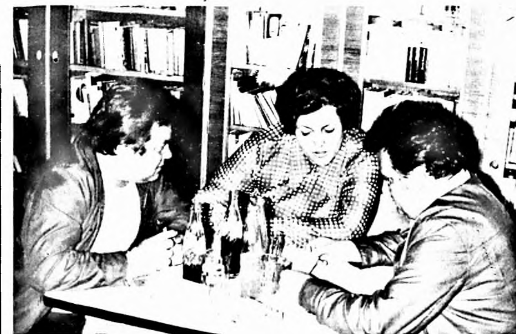
– En már tudom, hogy milyen kérdést húztunk.

Az anyagmozgatással kapcsolatos előírásokból összeállított