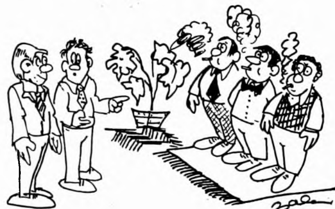
Munkában a trösztí degusztációs bizottság.

Nemsokára új termékkel lép meg vásárlóit a Pécsi Dohánygyár. Sláger lesz-e, vagy csak a választékot bővíti majd – ki tudja? A dohányosok ízlése kiszámíthatatlan. Azt viszont ki tudják számítani a szakemberek, hogy a rendelkezésre álló alapanyagból hogyan állítsák össze, mit kell tenni, hogy jó legyen, és a lehető legkevesbé legyen káros az egészségre.