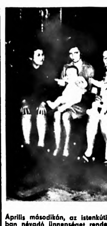
Április másodikán, az istenküti Gárdonyi Géza művelődési házban névadó ünnepséget rendeztünk, tíz gyári kisgyerek részére.