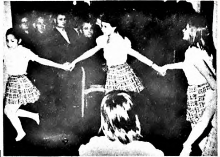
A Mátyás király utcai iskolások ünnepi műsora.