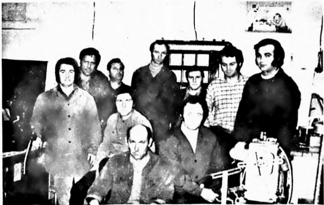
Kezükben a gyár „idegrendszeré”. A „Déri Miksa” brigádról a 3. oldalon olvasható riport.