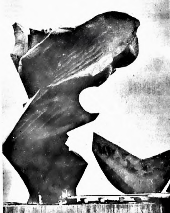
A pécsi felszabadulási emlékmű szoborkompozíciója: Makrisz Agamemnon alkotása.

Az eddigiekhez hasonlóan a továbbiakban még fokozottabb figyelmet kell fordítani a termelt árak minőségére. A fogyasztó, aki az általunk termelt cigarettáért pénzt fizet ki, elvárja, hogy pénzéért értékárnyos minőséget kapjon. A minőség alakulására a fogyasztói értékelés érzékenyen reagál. A minőségjavítás érdekében végzett eddigi tevékenységet úgy kell tovább fokozni, hogy vállalatunk termékeiről a széles fogyasztó közönség jó véleménnyel legyen és megbízható minőségűnek tartsa. Ezt az eredményt csak kollektív erőfeszítésekkel tudjuk elérni.