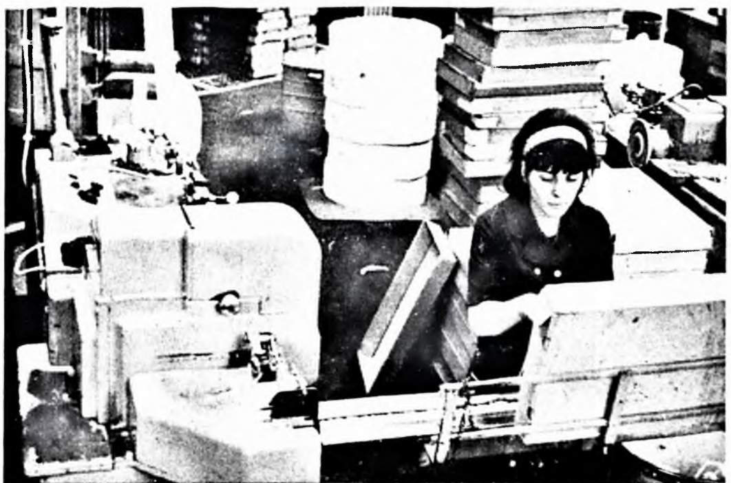
Az egyik Triumph filtergyártó gépünket kísérletképpen Dekajet formakamrával üzemeltettük. Az eddigi mérések alapján az így készült filterru dak méretartás és alak szempontjából pontosabak, mint a hagyományos módon előállítottak. A módszer általánossá tételétől a filter gyártási selejt és filterfelrakási hibák csökkentését várjuk.

Mint látható, a hazai füstszűrő lényegesen meghaladja az importált füstszűrő hatékonyságát.