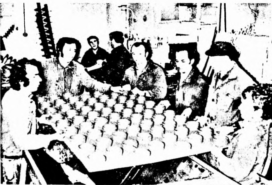
Készül a központi porleválasztó. Képünkön, a lakatosműhely dolgozói a porleválasztó lemez-Nagy László felvétele.

Pécsi Dohánygyár, gazdasági és tömegszervezeti vezetői