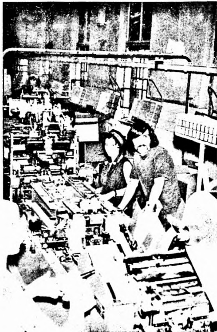
A Niepmann csomagológépen dolgozó „Ifjúsági brigád” február 7-én és 9-én is termelési rekordot produkált: műszakonként 3 millió darab cigarettát csomagoltak! Lapzártáig havi termelésük is rekordot ígér. Műszakonkénti átlagteljesítményük több mint 2 millió 700 ezer darabra emelkedett.

A papírosztályon a hatékony anyagfelhasználás mellett a gyártási és csomagolási osztályokhoz hasonlóan igen nagy szerepe van az eszközkihasználás fokozásának is. Az előzetes