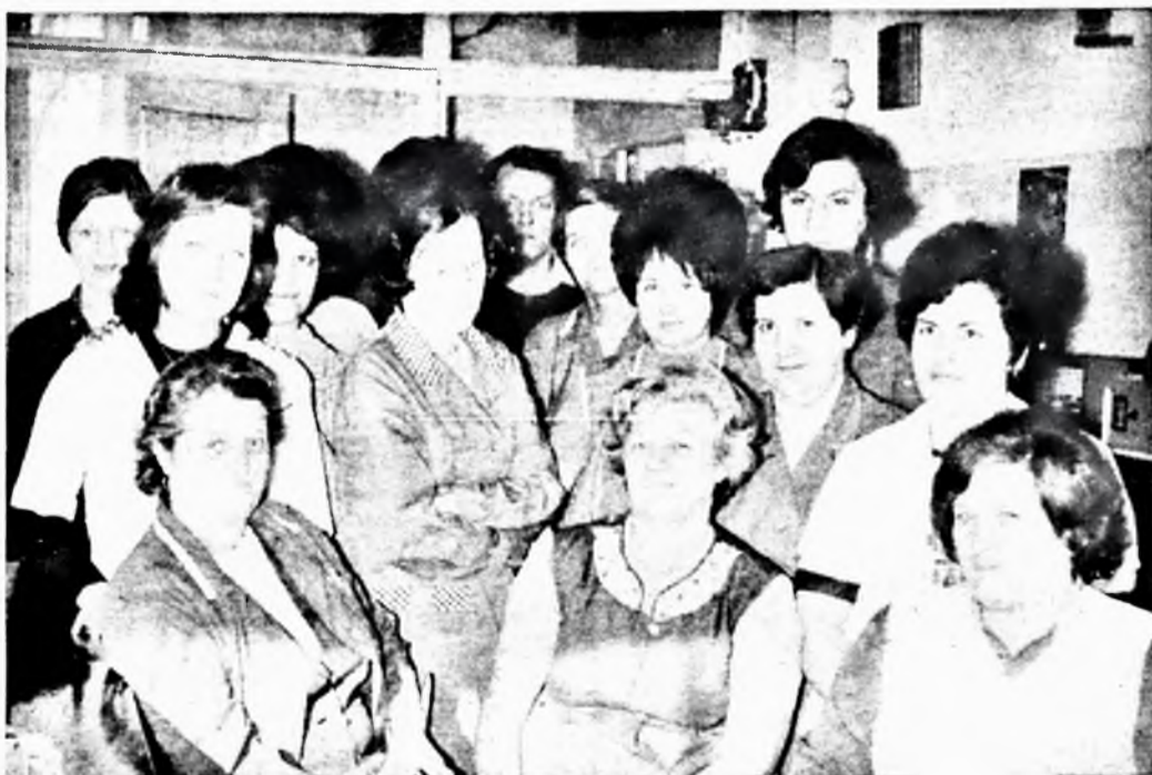
A laboratóriumi „Tabak” szocialista brigádjáról a 3. oldalon olvasható riport.

Az óév utolsó előtti napján kezdődött meg a hatvan férőhelyes üzemi óvoda műszaki átadása. Jelenleg a hiánypótlási munkának dolgoznak a festők, a parkettázók és a felvonószereplők. Az óvoda építési munkáinak befejezését követően a földszinti negyven férőhelyes bölcsőde építése folytatódik. A kőműves munkák zömével befejeződtek, elkészült a központi fűtés, a vízvezeték- és csatornaépítés. A munkák jelenlegi készülségi fokát figyelembevéve joggal számíthatunk arra, hogy az építők teljesítik vállalatukat, az egész komplexum kivétel nélkül hazánk felszabadulásának 30. évfordulójára elkészítik.