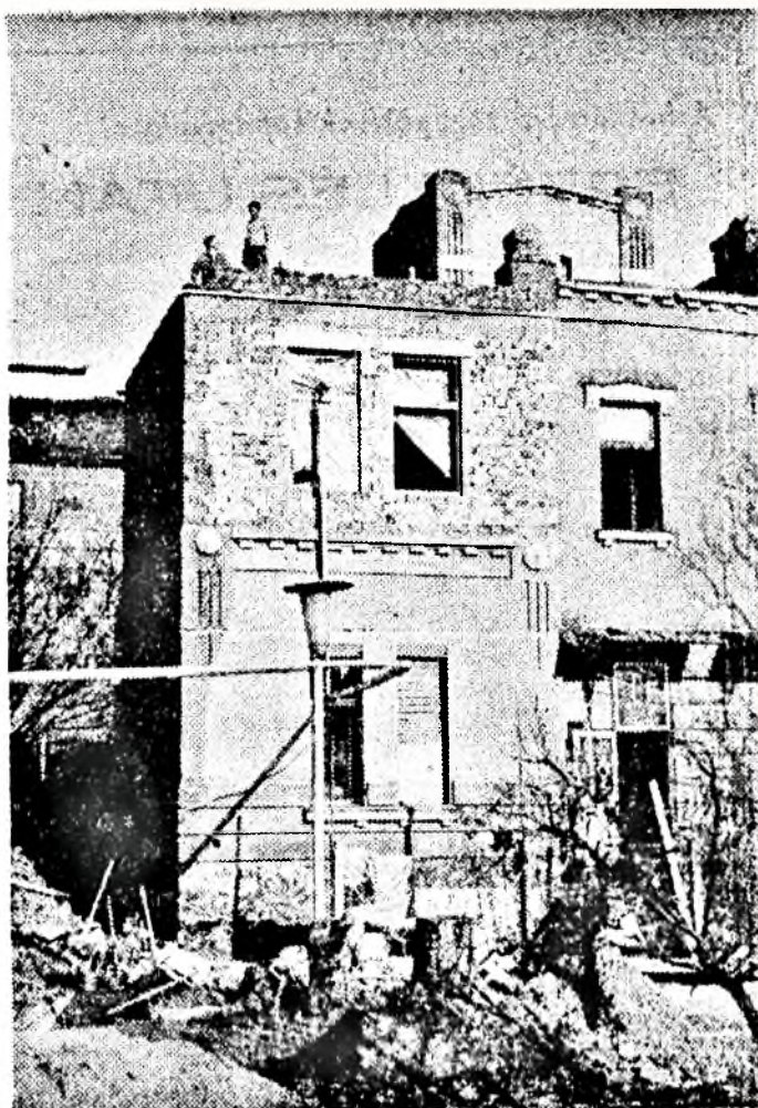
December harmincadikán kezdődik a gyári óvoda műszaki átadása. A több mint egymillió forintba kerülő létesítmény hatvan kiskisgyerek óvodai oktatását biztosítja. Eddig több mint tízezer munkaadót dolgoztak vállalatunk dolgozó, a kivitelező vállalatok munkásai az új óvoda kialakításán.