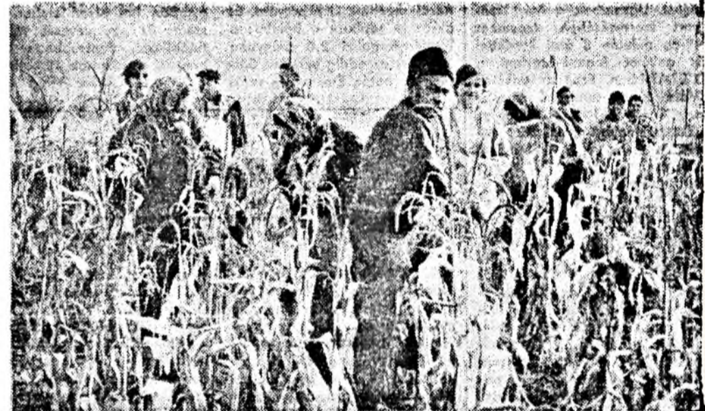
A kishajmási termelő szövetkezet táblájában