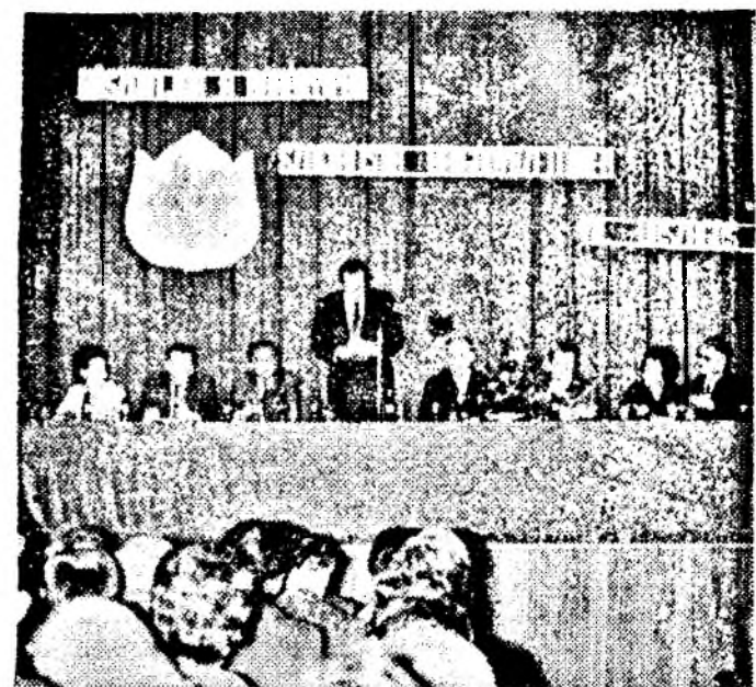
Debrecenben tanácskoztak iparágunk szocialista brigádvezetői. A tanácskozás elnöksége.