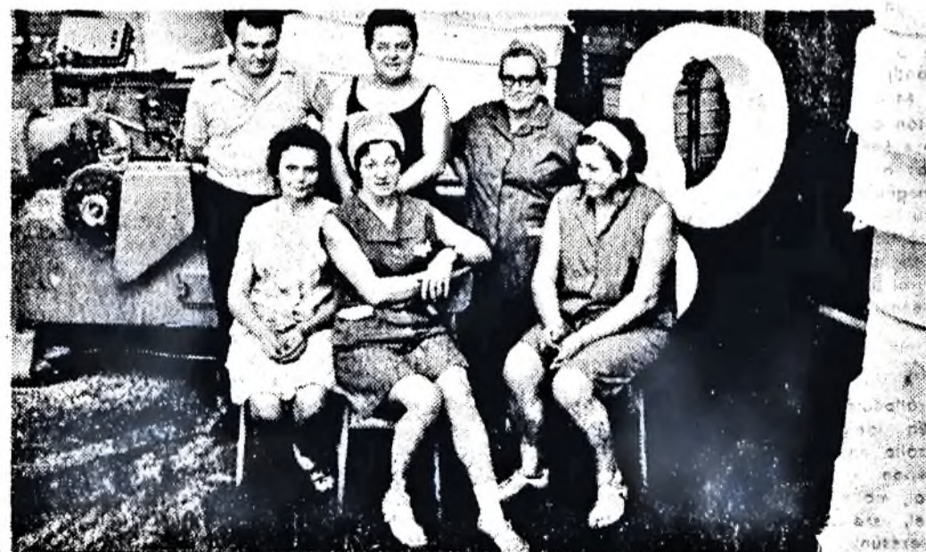
A Mező Imre szocialista brigád műszakon lévő csoportja. Életükről, munkájukról a harmadik oldalon lévő riportban szólnak.

Az értékeléshez szükséges adatokat az osztályok adják a tervosztály részére, ahol az értékelés történik. A verseny tisztasága, valamint az objektív értékelés érdekében kizáró íeltételek is vannak. Ezek: üzemi baleset, gyártmánycsere, vagy a gyártó, csomagológép napi teljesítménye két esetben selejt miatt kizárásra került. A versenyről minden termelő részleg nyilvántartást vezet. A verseny 1974. július 1-től szeptember 30-ig tart, a kiértékelés időpontja 1974. október 5.