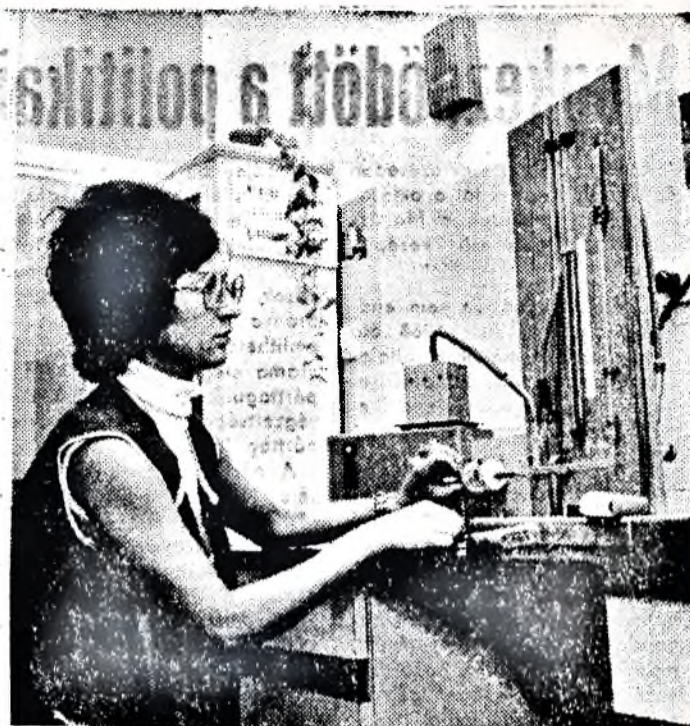
Szűrhatékonysági vizsgálat üzemi laboratóriumunkban.