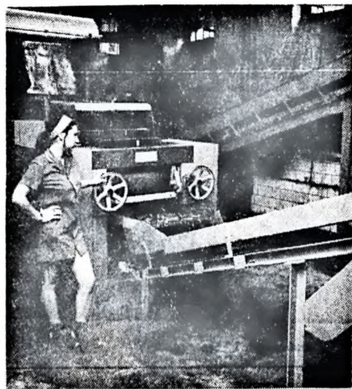
Új angol gyártmányú kocsánylaposító gépet helyeztünk üzembe gyárunk előkészítő üzemrészében. Az 1,2 millió forintba került berendezés óránként négyszáz kilogramm dohány előkészítésére képes.