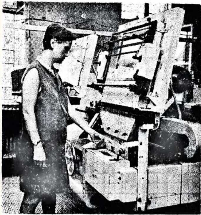
Automata kapcsoló a Skoda gyártmányú csomagológépen. A plexi ajtó kinyitását követően a gép leáll.