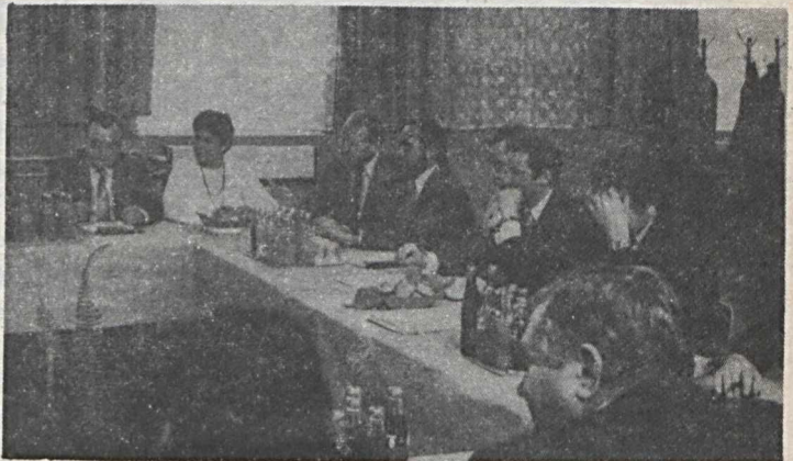
3. A VT tagjainak egy csoportja.