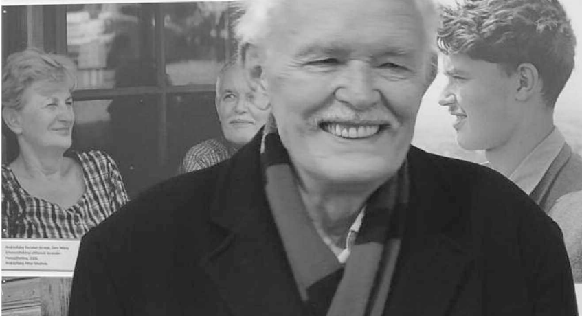
Andrásfalvy Bertalan és fia, János Bertalan, 1940. évi születésű, 1940. évi születésű, 1940. évi születésű.

A Janus Pannonius Múzeum Néprajzi Osztálya Jövők gyökerei című kiállításal tiszteleg Andrásfalvy Bertalan néprajzkutató előtt. A novemberben nyílt tárlat március 1-ig tekinthető meg. A neves néprajzkutató 90. születésnapjára rendezett kiállítás az ünnepezt népművészeti tárgyú kutatásait mutatja be. Megismerhetjük a néprajzi gyűjtőutak miliójét, a népzene- és néptánc-kutatás munkamódszerét és a gyűjtéseken készült felvételek páratlan darabjait. A kiállításból feltárulkozik Andrásfalvy Bertalan évtizedek során kimerült népművészet koncepciója, amely kutatása tárgyát nem formai és stílári szempontok, hanem emberi és társadalmi szükségletek alapján vizsgálja. A népművészet – elgondolása szerint – nem öncélú, és alapvetően nem színpadra szerkesztett alkotások tárháza, hanem az egyén kiteljesedésének és külvilágra adott reakcióinak a tükröképe, de a társadalmi és gazdasági változások érzékeny közege is.