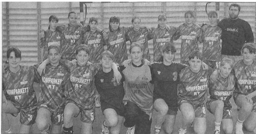
A Tej-kupa megyei döntőjének, a diákolimpia III. korcsoport megyei döntőjének és a Dunántúli Napló-kupa győztese, a hosszúhetényi leány kézilabdacsapat. Állnak (bairól): Papp, Rudas, Takács, Schmidt, Mihályi, Elter, Tarr, Görföl, Csajkás Géza edző. Guggolnak: Spéth, Szanati, Kraut, Elter, Gunszt, Fuchs, Gasteiger, Döme, Török.

Részt vettek Teramoban, a világ egyik legjelentősebb utánpótlás tornáján a 13-14 éves korosztályban, ahol 3. helyen végeztek.