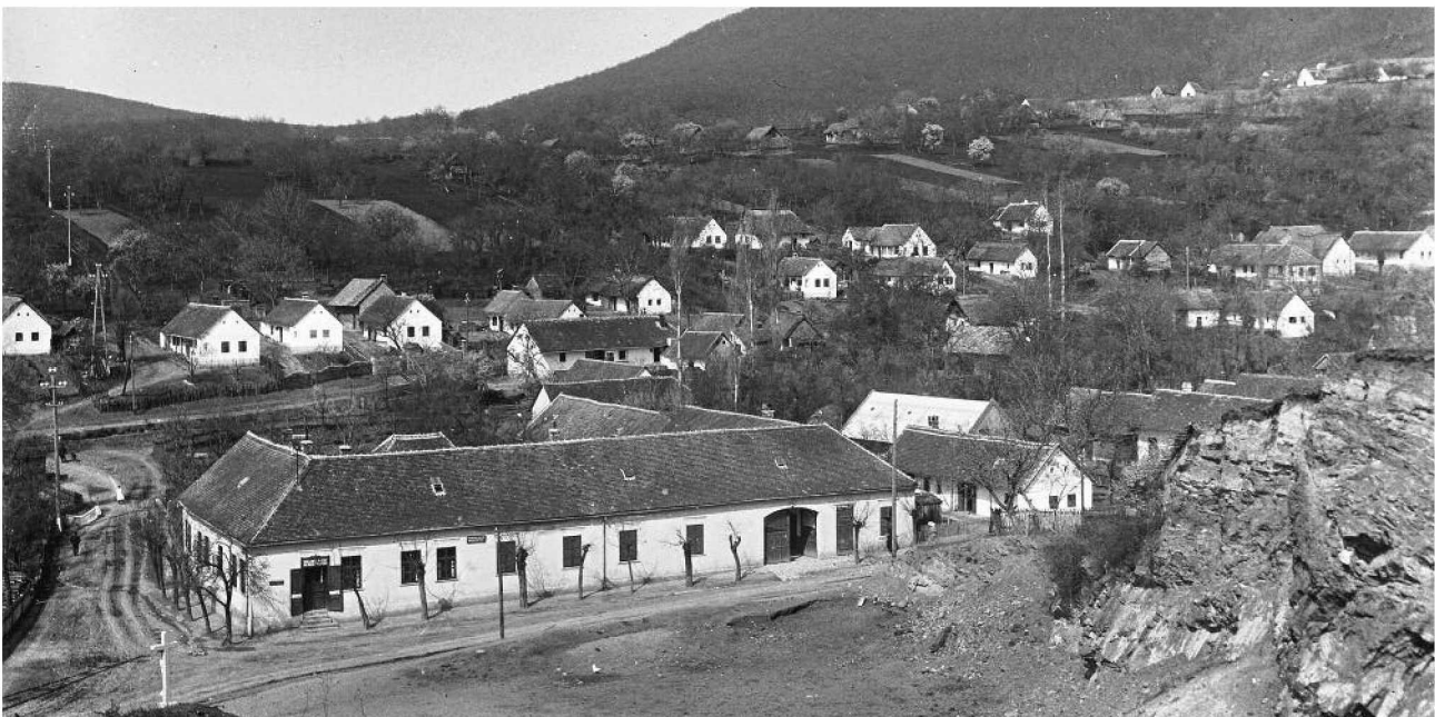
Az új mozi megnyitásáig a Schellenberger kocsmában zajlottak a vetítések.