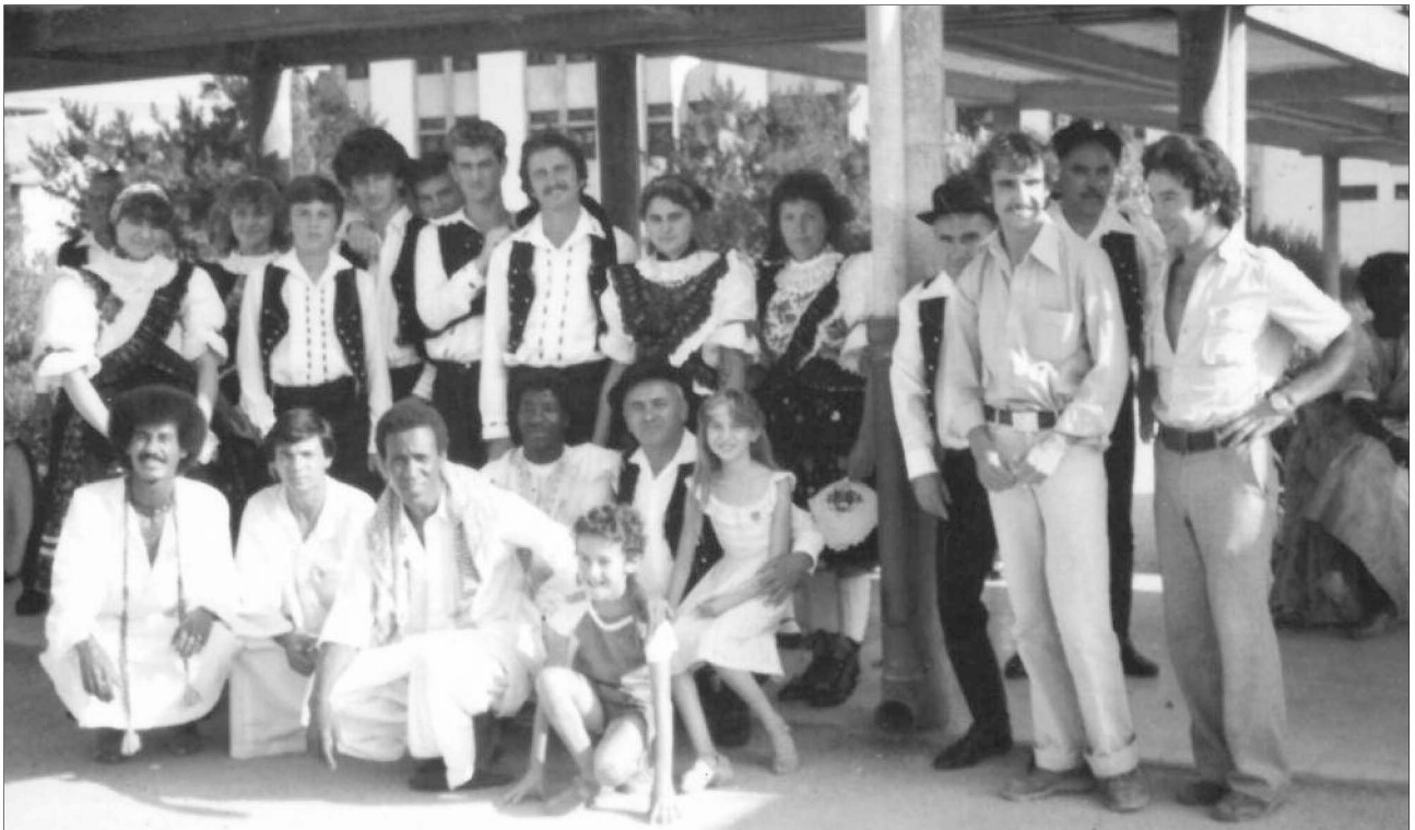
A csoport egy része a fesztivál házigazdáival az algériai fesztivál idején.

Szép volt! Jó volt! Kár, hogy megöregedtünk!