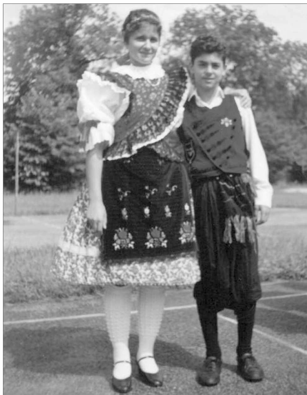
Egy szardíniai táncos kíséri a zakopanei fesztivál napjaiban 1991-ben.

Szerettük, amikor családoknál laktunk, akikkel barátságot is kötöttünk, és akiket mi is vendégül láttunk később, de fergeteges hangulat tudott uralkodni egy-egy közös szálláson. A zakopanei nemzetközi néptánc találkozó nagyon bevésődött, ahol többek közt az olaszországi, szardíniai csoport tagjaival összebarátkoztunk és én gyakorolhattam kedvenc nyelvemet, sőt, még segített a többieknek is az ismerkedésben. Szerelmi románcok is szövődtek itt, amelyek sűrű levélváltással folytatódtak (egy levél per hónap...).