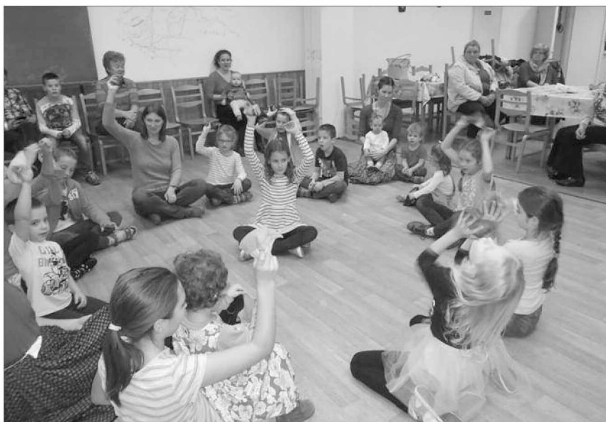
A családi táncpróba és táncház a kicsik játszójával kezdődött, ahol szüleikkel együtt a kézügyességük után a "lábügyességüket is kipróbálhatták"

Az évet szilveszteri bál rendezéssel zártuk, melynek bevételét az egyesület működésére fordítjuk.