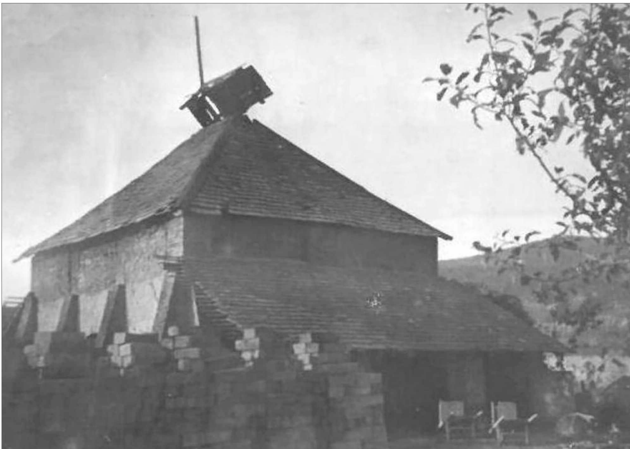
Az egykori téglaház, a Bocz család téглаégetője. A ma már nem látható épület helyén tsz major létesült. Ma magángazdaság.

Érdekes volt édesapám és a téglamunkások kapcsolata! Nem munkaadói és munkavállalói viszony volt köztük, hanem komaság, hisz sok évtizedes munkakapcsolatuk volt, és édesanyám-édesapám keresztvíz alá tartotta, vagy bérmáltatta a két