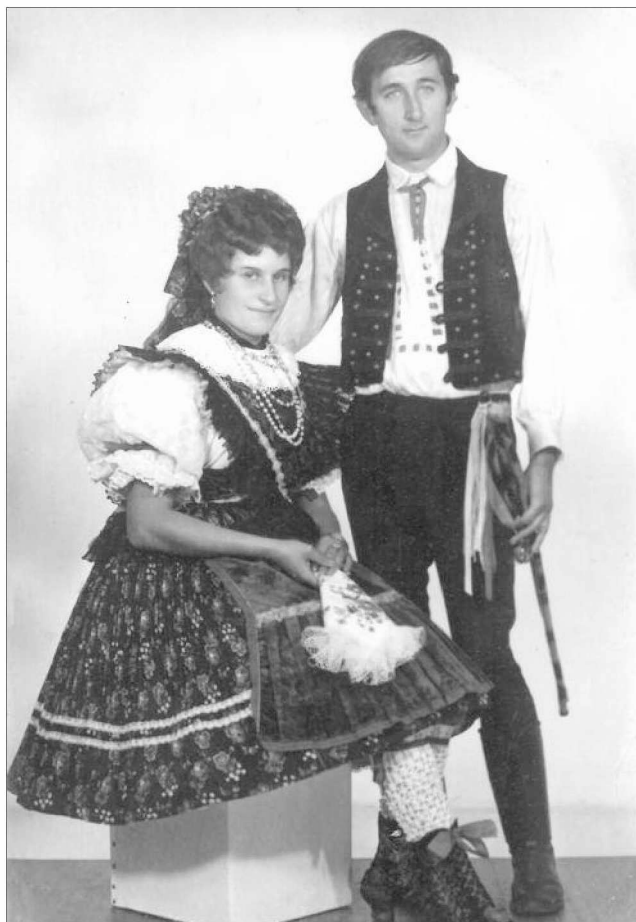
Mútermi fotó egy fellépés előtt, talán 1975-ben

Zielona Gorában, kollégiumban laktunk. Minden szálláshoz tartozott egy éjszakai bár is. Kaptunk a szervezőktől egy-egy