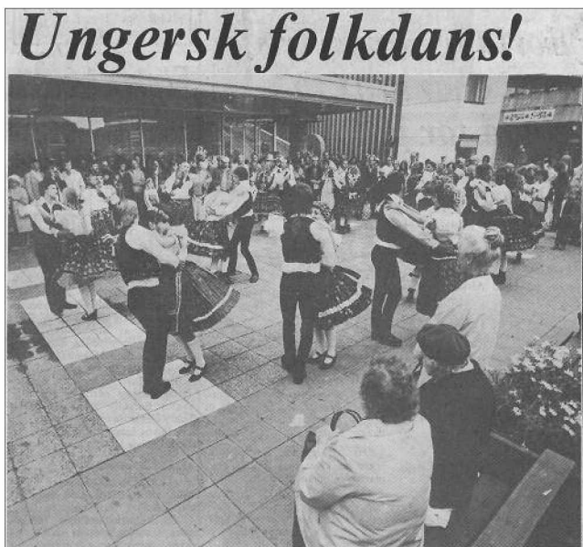
Ett hundratal falubor stannade upp ett tag i brådskan för att se västeuropeiska premiären för ett ungersk folkdanslag. — Se hit, fastman till salu! heter dansen som ingår i en traditionell ungersk bröllopsfest.