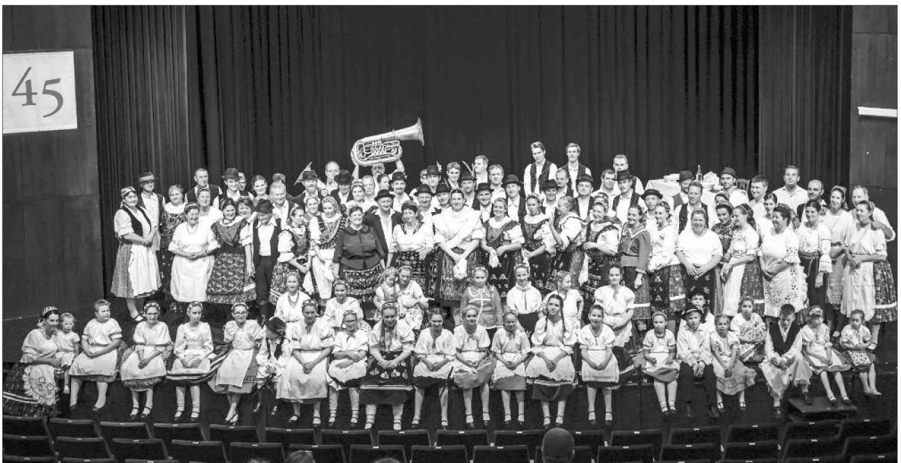
Október 7-én Komlón ünnepelte megalakulásának 45. évfordulóját az együttes. A gálaműsorban egykori táncosok, zenészek is felléptek, a színház előcsarnokában fotókiállítás idézte fel az elmúlt évtizedeket.

Készült Pécsen, Molnár Csaba nyomdájában