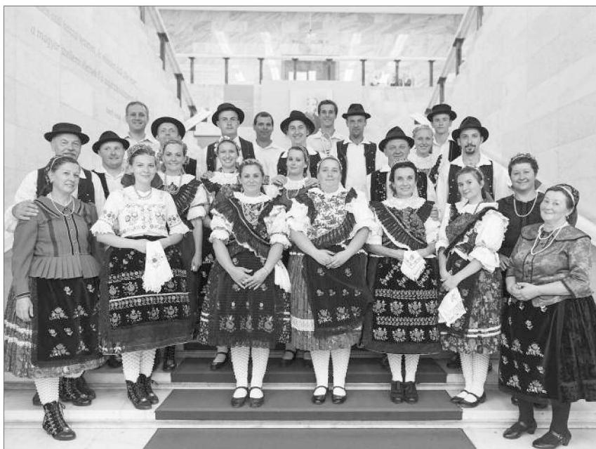
Augusztus 3-án a Budai Várban, fellépés után az Országos Széchényi Könyvtár lépcsőjén.