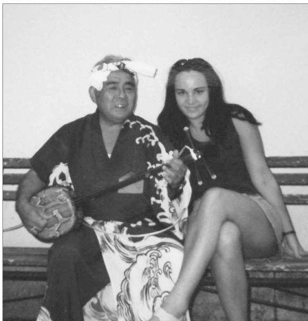
Egy kicsi halászfaluból érkeztek a japánok, akikkel nagy mulatságot csaptunk egyik fellépésünk után.