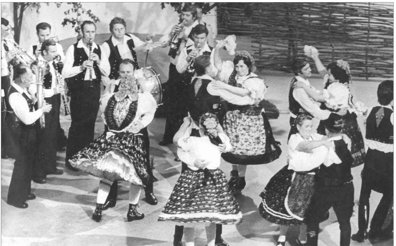
Televíziós felvételen 1977-ben a Röpülj páva! vetélkedőműsor záróképében

A Szövetkezeti Együttesek Országos Néptáncfesztiváljának szekszárdi területi bemutatóján az együttes