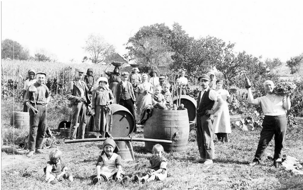
A hagyományos családi munkaalkalmak és kapcsolatok eltűnésével a hagyományok átadása is megszakad.

A természettel való kapcsolat éppen olyan létezésük, mint az emberek közti. A legújabb ökológiai szakirodalom bebizonyítja, hogy az ember természettel való kapcsolata csak ott szakadhat meg, ahol korábban az ember és ember közti kapcsolat megromlott, így egy törpe kisebbség kisajátíthatja a természet minden embert megillető kincseit. A természettől elszakadt társadalom pedig épp úgy halálra van ítéelve, mint az elmagányosodott egyén.