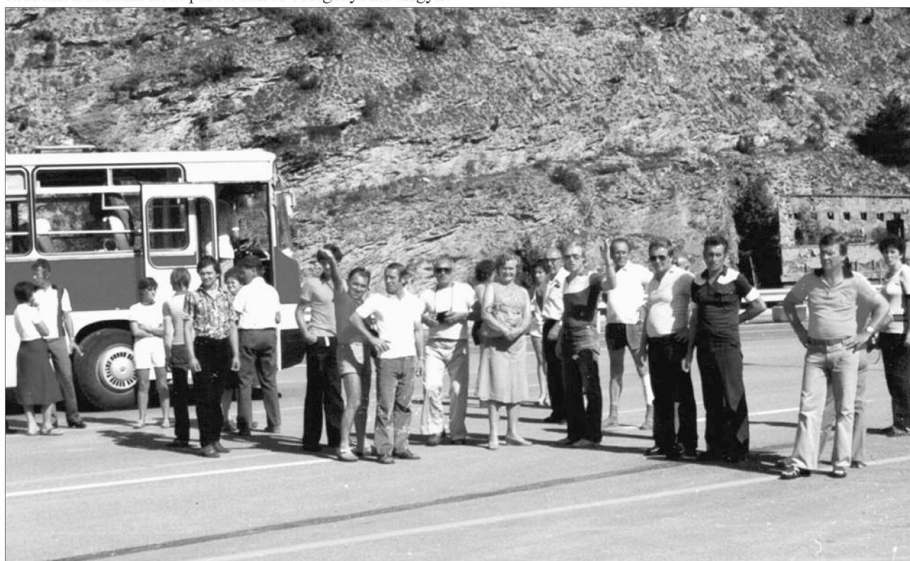
Franciaországi turnén 1981 nyarán.

Ősszel részt vett az együttes Sellyén, az Ormánsági Napokon és az ÁFÉSZ-együttesek gáláján Pécssett.