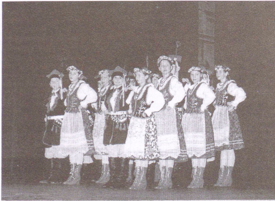
Október 24-25-én mutatkoztak be az iskolák a Kossuth Filmszínházban: Lengyel testvérvárosunkból, Siemianowice Śląskie-ből a művészeti tagozatos Witold Budryk Általános Iskola táncosai, zenészei, énekesei.

Nagy fába vágta fejszéjét az alig több mint egy éve működő Mohácsi Alapfokú Művészeti Iskola, amikor városunkba hívta három ország egy-egy iskolájának ifjú muzikusait, táncosait, képzőművészeit és színjátzóit.