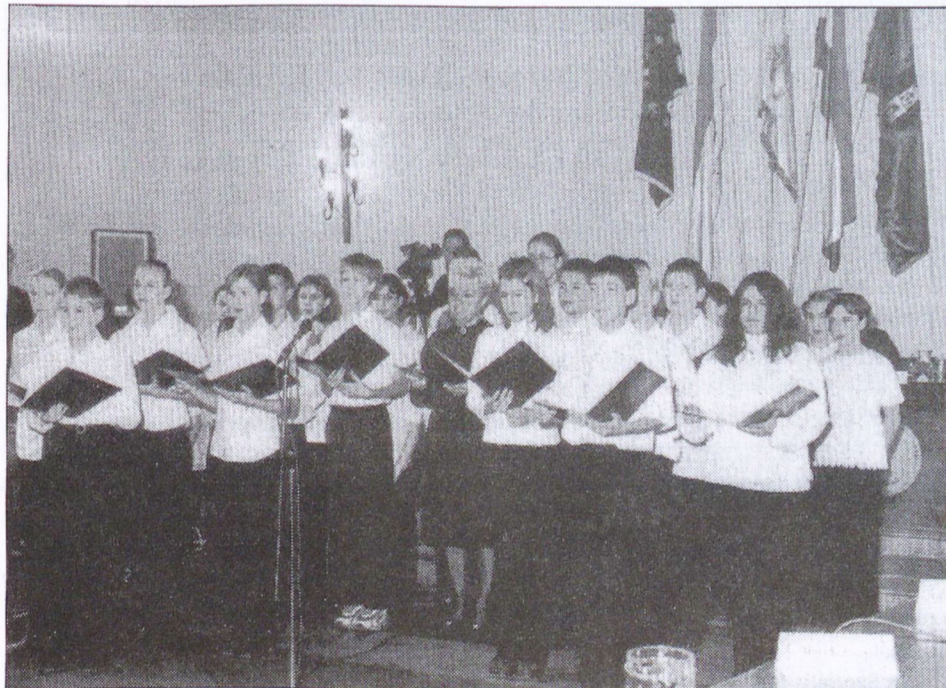
Az ünnepi eseményen a Brodaries Téri Általános Iskola diákjai színvonalas műsorral vettek részt.