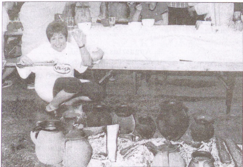
... Ilyen finom...!!!

vendége is volt a rendezvénynek, mint pl. a Magyar Rádió Nemzetiségi szerkesztőségeinek munkatársai, vagy a határon túlról az Eszéki Rádió igazgatója, és annak Magyar Szekciójának vezetője, és még sokan