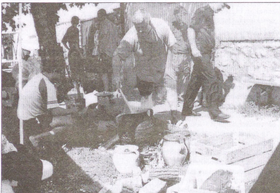
Felvételünk a legnagyobb agyagedényről készült