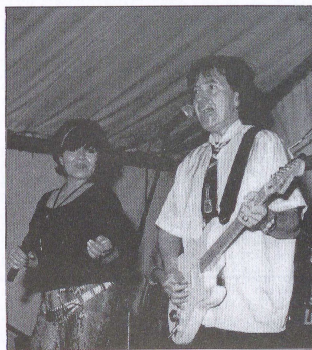
Dolly az Asterix együttesel

A hely sajátos hangulata jelentősen hozzájárul a sör-