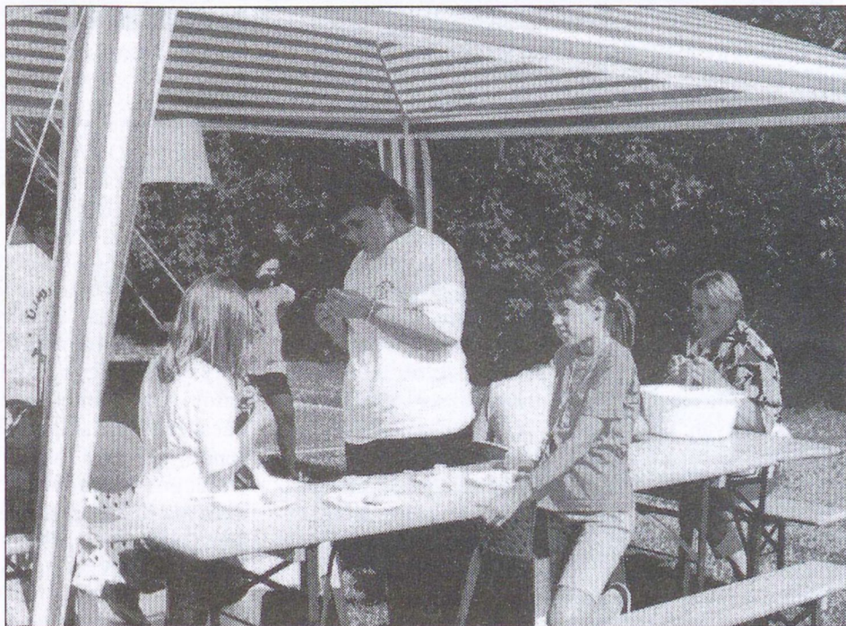
A legfiatalabbak gyöngyfűzés és apróbb ajándéktárgyak készítése közben.