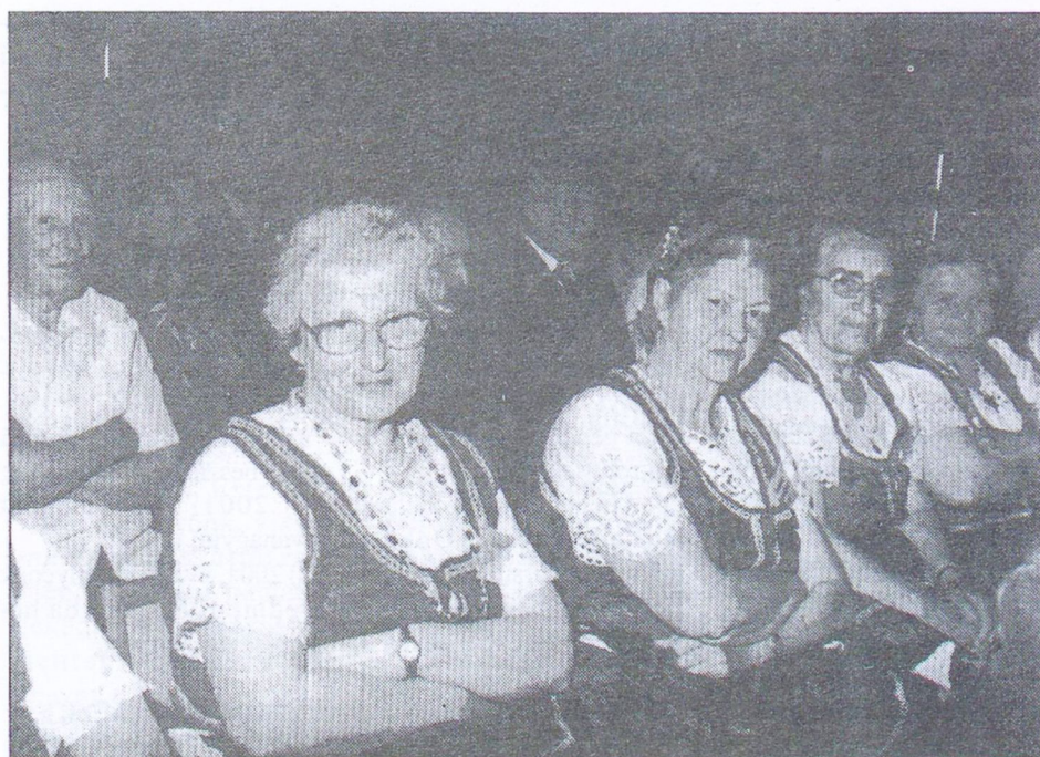
A képünkön látható nyugdíjasok szívesen öltöztek népviseletbe, hiszen ezen a délutánon előadóművészek is voltak.

2002. május 3-án, Nyugdíjas Fesztiválra invitálta a Mohács és Környéke Önszegélyező Csoportja és Érdekegyeztető Szövetsége, valamint a Területi Nyugdíjas Képviselet a térség nyugdíjasait a Bartók Béla Művelődési Központba.