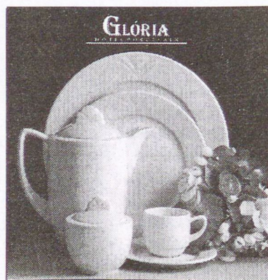
Zsolnay és Hollóházi porcelánok