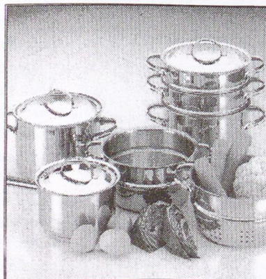
12 részes edénykészlet - rozsdamentes- 8990 Ft