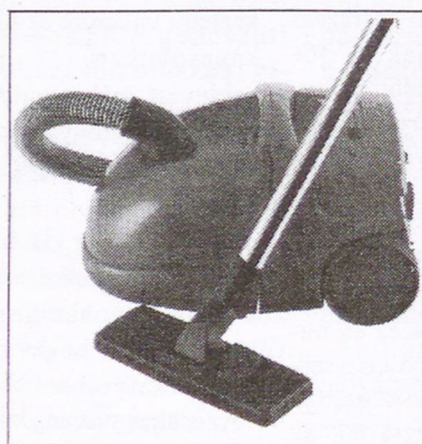
Akciós ZELMER porszívó 1400 W 9990 Ft

7700 Mohács, Vörösmarty utca 2. Telefon: 69/510-255