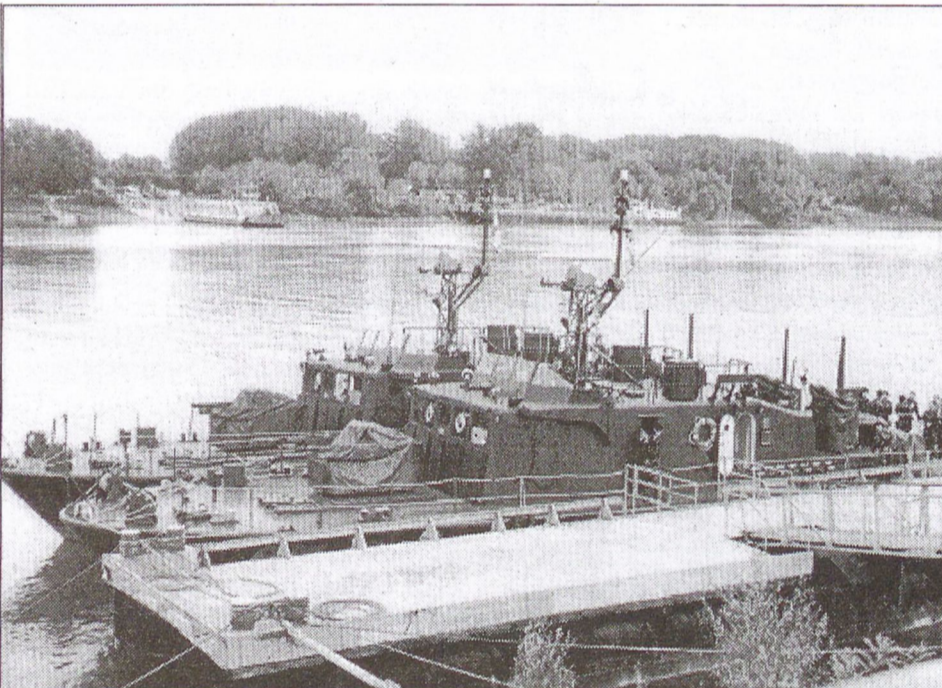
Október 10-én két aknamentesítő naszád kötött ki a mohácsi Duna parton. Az egység parancsnoka munkatársunknak elmondta, hogy az éves újonckiképzés kapcsán hajónak végig a Duna magyarországi szakaszán. Érdekességként megtudtuk, hogy ez a két hajó kísérte a "Szent Koronát" Budapestre Esztergomba.

Európai Unió csatlakozásunk kapcsán nagyon sok feltételnek kell megfelelnünk. Ennek egyik kis szegmense, a határőrség feladatainak átalakulása. Megszűnnek az Unió belüli fizikai határok - talán a sokat utazók örömeire, hiszen eltűnnek életünk-ből az órákig tartó sorbaállások -, de egy hátulütője is lesz a dolognak, több bűnöző kerülhet az országba. Ha felidézünk egy közeli, az egész világot megrázó eseményt: az Amerikát ért terrortámadást, akkor azt hiszem, mindenki elgondolkozik az ellenőrzések fontosságán. Természetesen ezt a fajta határellenőrzést felváltja a belső ellenőrzés. Aki járt már Unió országban, tapasztalhatta, hogy útközben megállítják őket, elkérik az okmányokat, majd egy központi