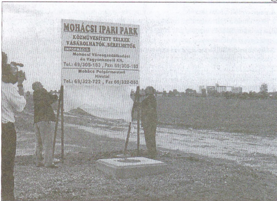
A 2000. esztendőben megvalósult a MOHÁCSI IPARI PARK