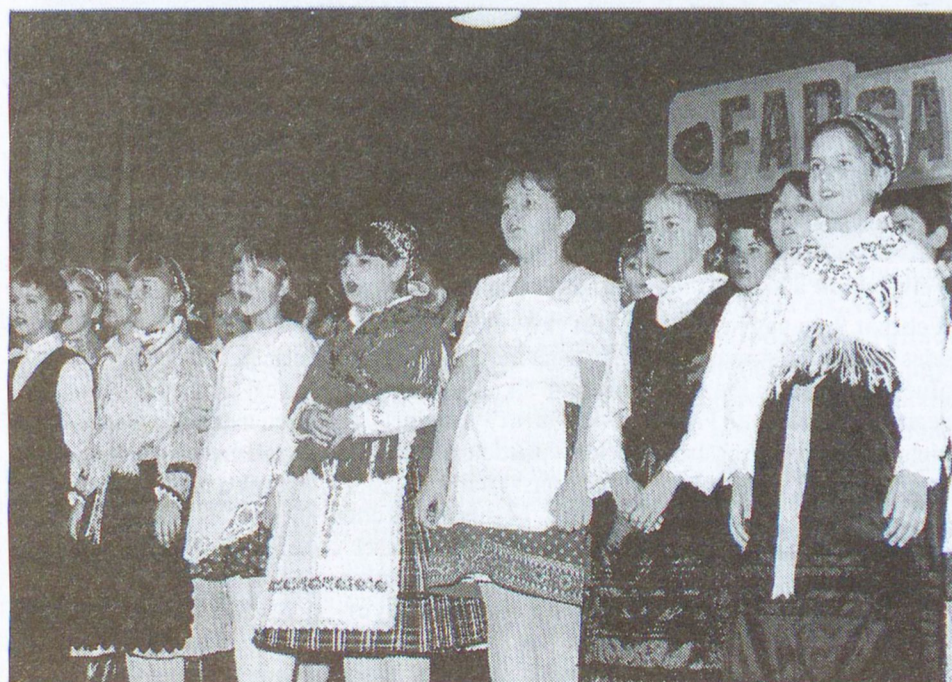
A nemzetiségi műsor félszáz német népviselet bemutatójával zárult