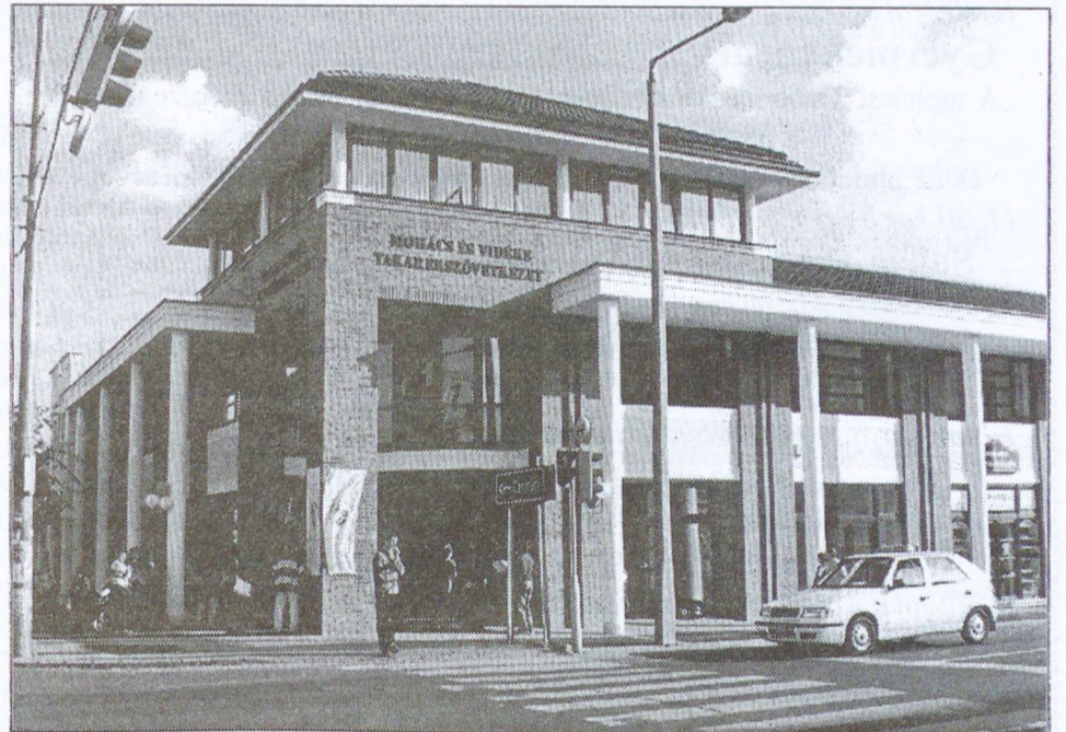
A 2000. esztendőben folytatódott a városban az utcasarkok beépítése. Képünkön az egykori "Blum Vendéglő" helyén az új, impozáns Városkapu épülete.

A Budapesti országút és a szeméttelép környékének állapotán is javítani szeretnénk, a város ezen bevezető szakaszát is rendezetté kívánjuk tenni. Nem nagy dolog, de vásároltunk egy részszakaszát, ennek segítségével is szeretnénk