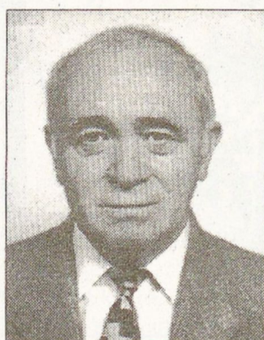
tozik, és tudunk tárgyszerűek lenni.

- Minél több ember dönt egy ügyben, annál nehezebb dűlőre jutni, ha nem „kézvezélynélről” van szó. Mondtam már: a testület értékes egyénekből áll, de talán csoportlélektani dolog, hogy egy jó összetételű grémium is miért tud néha lehetetlen lenni... Elhibázott döntéseink is voltak, alapvetően mégis elégedett vagyok, mert egyre kevesebbet nyom a latban, hogy ki melyik politikai karámba tar-