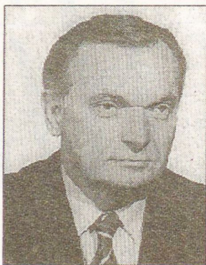
valónak tartja ezt?

- Az előző ciklusokban a nyilvánosság előtt vitatták meg a határozatokat, most úgy tűnik már a bizottságoknál eldől a szavazás rendje. Helyén-