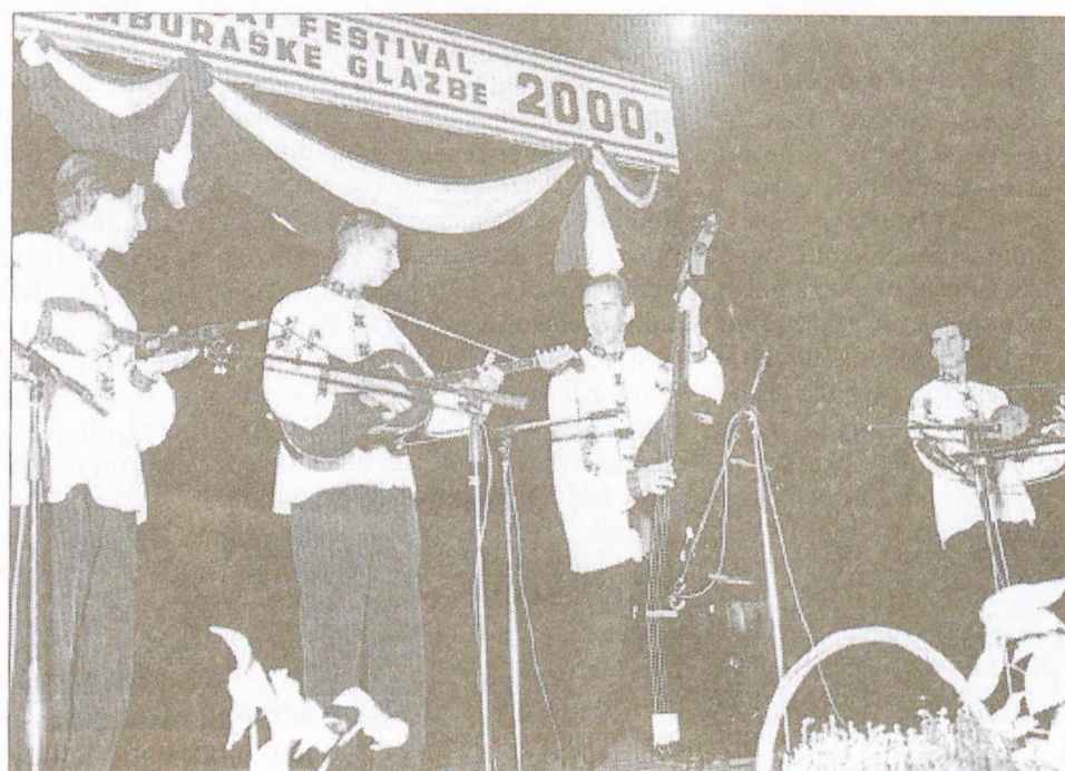
Második helyezést ért el a Baranya zenekar.