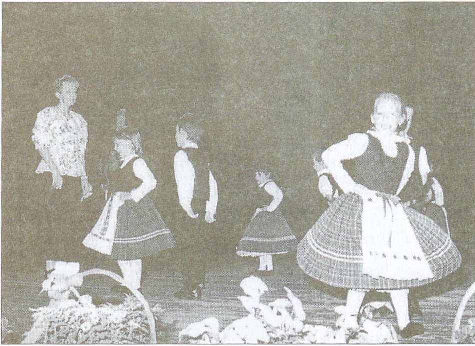
A Park utcai óvodások német gyermekjátékokat mutattak be.