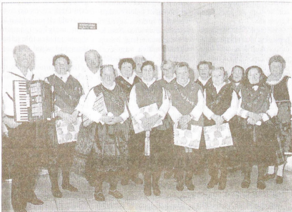
A Sombereki Nyugdíjas Klub népi iséletbe öltözött tagjai német nemzetiségi műsort mutattak be.

A fesztivált Katona József alpolgármester nyitotta meg. Köszöntőjében visszaemlékezett arra amikor még csak ígéret és remény volt a nyug-