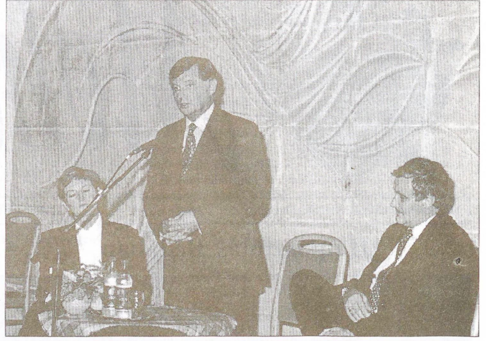
Október 9-én Mohácson járt és fórumot tartott Németh Miklós, egykori miniszterelnök. A politikus beszámolt a politika aktuális kérdéseiről, valamint országjáró tapasztalatairól. A fórumot teljes terjedelmében közzé tette a mohácsi földi sugárzású Csele Televízió.