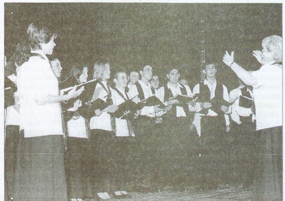
Képünkön az idén december 9-én öt éves Singende Quelle kórusa.