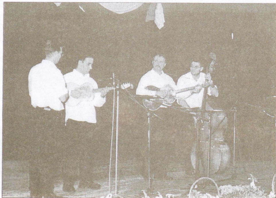
Felvételünkön az első helyezést elért tököli Zora zenekar.