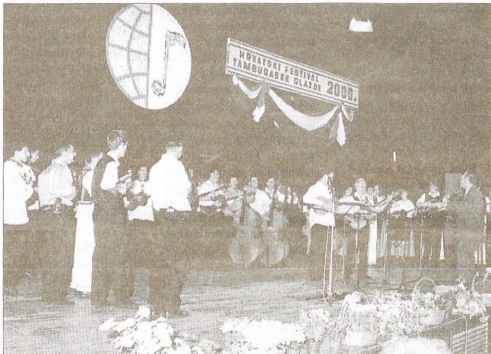
A színpadon a fesztiválon résztvevő hat zenekarból álló együttes a zárószámot játsza.