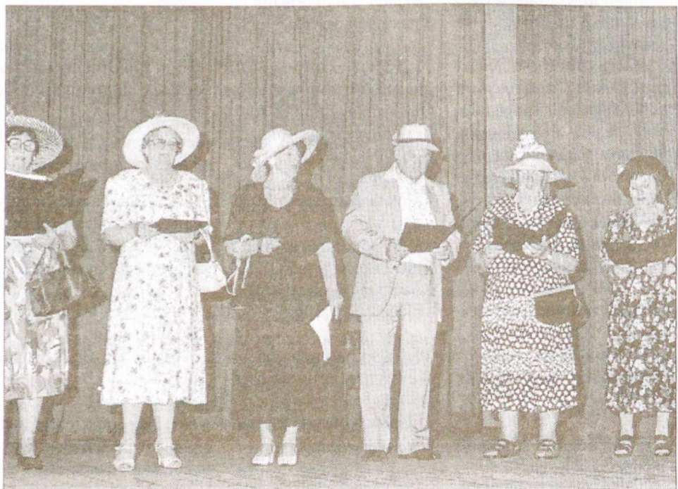
A sátorhelyi nyugdíjasok Budapestről szóló összeállítással kedveskedtek a vendégeknek.

Ünnepelőbe öltözött nyugdíjasok töltötték meg a Bartók Béla Művelődési Központ széksorait október 14-én.