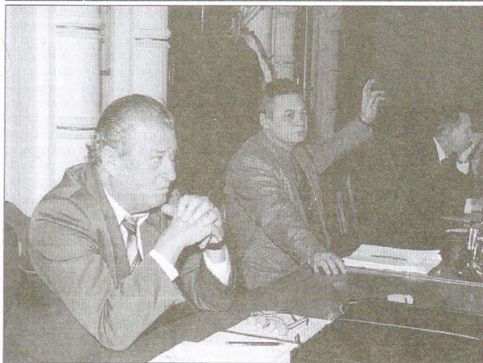
Munka közben: téma a költségvetés