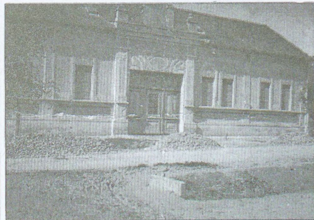
A Glasel - Gossmann ház