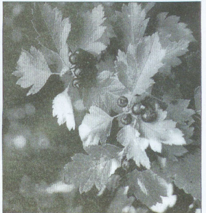
Fekete galagonya - Crataegus nigra

- 1996-ban a tájvédelmi körzet a Duna-Dráva Nemzeti