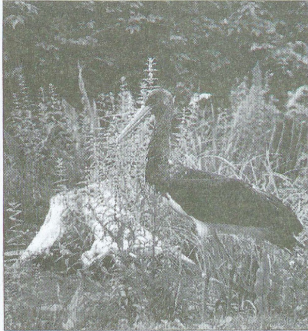
Fiatalkék gólya - Ciconia nigra